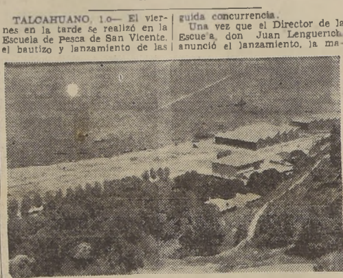
Vista panorámica de la bahía de San Vicente.

Especiales caracteres adquirió la ceremonia del lanzamiento de las embarcaciones construidas por los alumnos de la Escuela de Pesca