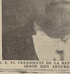
S. E. EL PRESIDENTE DE LA REPUBLICA, EXCELENTISIMO SEÑOR DON ARTURO ALESSANDRI