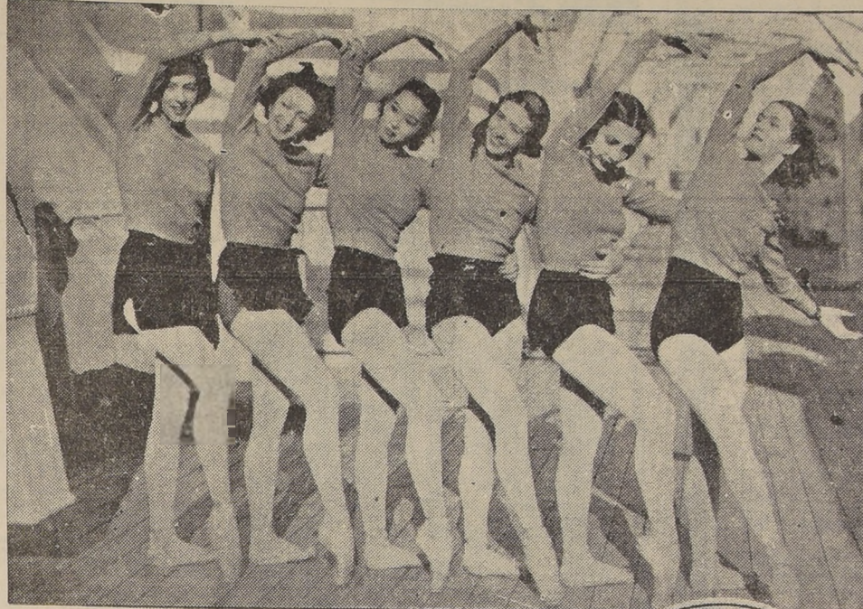
Bailarinas de la famosa troupe rusa de Montecarlo ensayando un paso de ballet sobre la cubierta del "Ile de France", que las conducía a Estados Unidos, contratadas para el Metropolitan Opera House, de Nueva York