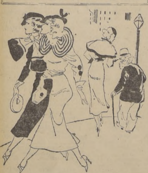
—No te parece que ya es tiempo de que te pongas serio, abuelito?