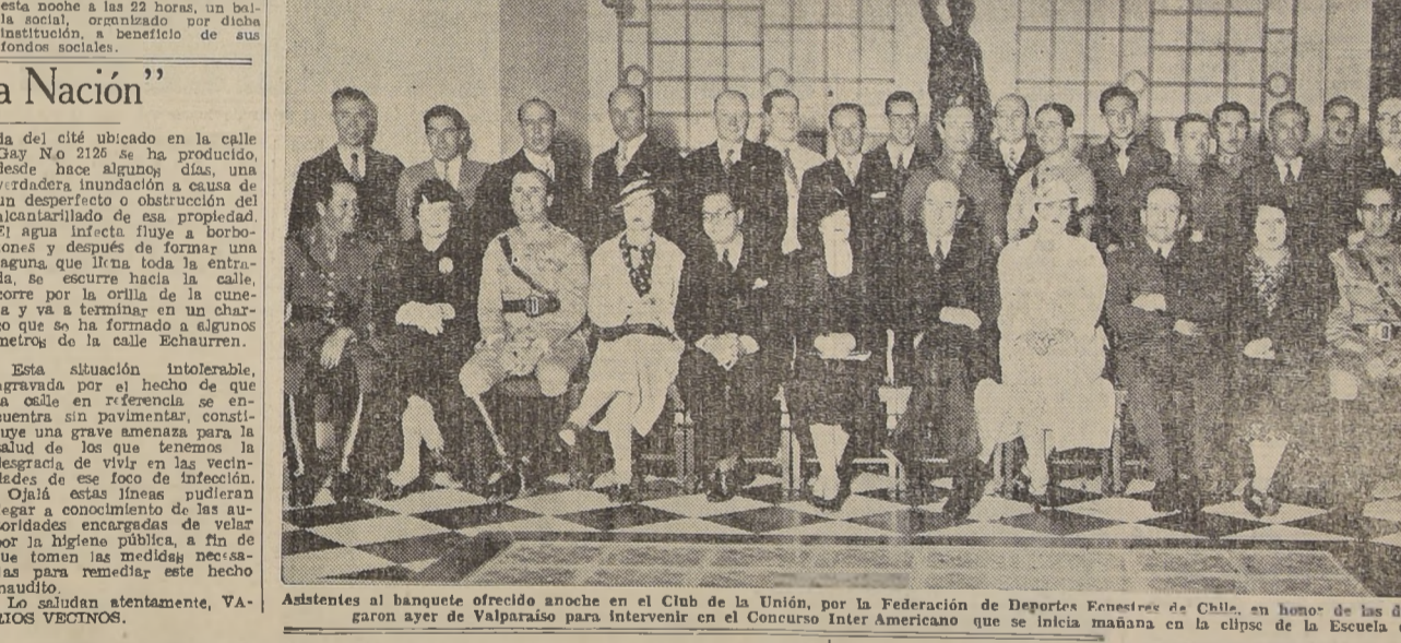
Asistentes al banquete ofrecido anoche en el Club de la Unión, por la Federación de Deportes Ecuestres de Chile, en honor de las delegaciones extranjeras que llegaron ayer de Valparaíso para intervenir en el Concurso Interamericano que se inicia mañana en el clipse de la Escuela de Carabineros.