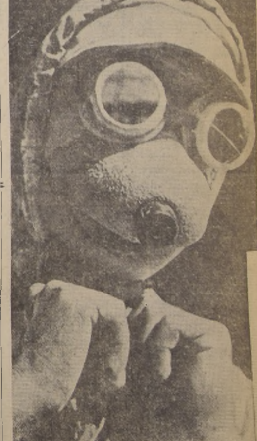
Los encontramos en presencia de uno de esos seres de pesadilla imaginados por los novelistas que escriben a la manera de Wells? Nada de eso. Es un simple obrero de una fábrica de gases de Alemania, que compendia en su traje y en su labor, el poder militar del futuro.