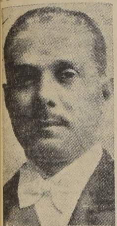
Excmo. señor general Rafael Trujillo, Presidente de la República Dominicana

Nacida a la vida independiente en 1840 la República Dominicana cumple hoy 93 años de vida independiente. En 1835 los ingresos fueron de 7.496.636 dólares y los egresos de 7.257.967.95 dólares.