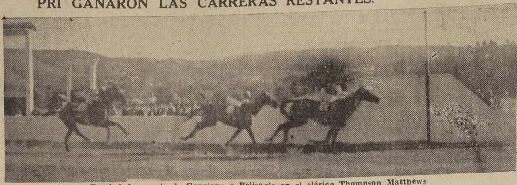
Bonidad da cuenta de Genciana y Belisario en el clásico Thompson Matthews

Las bondades evidentes del programa organizado, llevaron a una buena concurrencia a pre- guntar las carreras de ayer en el Valparaiso Sporting Club, las que se desarrollaron en medio del mayor entusiasmo y cuyos triunfos fueron del más alto nivel en la mayoría de las pruebas.