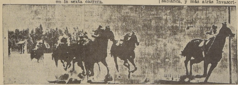
Canigó, en un "cáncer", se impone sobre Aprietito, Rosellón y Sardo en el compromiso principal.

antero, mientras el puntero retrocedía batido. En los últimos metros atropellaron Happy Feet y Ampíame, situación que se prolongó hasta el mismo disco de sentencia donde el hijo de Kodak llegó con medio cuerpo de luz sobre Happy Feet, la que aventajó a Ampíame por medio pescuezo. El cuarto puesto lo ocupó Don Nadia delante de Firuz, Ardoroso y Emisario. Último Tole Role. CUARTA CARRERA Nuestro favorito Descuido, abandonando casi cuarenta pesos por unidad, se impuso sobre Revuelta y Ouracán en esta carrera, que correspondía a la quinta serie del premio "Chacoli". Alzadas las cintas Ouracán se hizo cargo de dirigir el grupo, asediado por Descuido, Destronada y Revuelta con Paganini y el favorito El Fayum abrigados al fondo. Frente al palo que demarca los 1.200 metros Descuido desplazó a Ouracán distanciándose hasta tres cuerpos, mientras tercera corría Revuelta delante de Destronada, Balazo y Tandra, orden en que giraron la curva y entraron a la recta final. A la altura de la "popular" Revuelta se ubicó segunda, pero