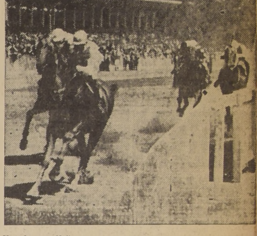
Negret vence fácilmente a Juan Tenorio, Sandial y Omar Kaylam en la penúltima carrera.

que completamente "levantado", quedó atrás por un cuerpo. Tercero fué Rosellón delante de Sardo, Huelén, Como No! Último remató Cancionero. SEXTA CARRERA Pif Paf, en acción relativamente fácil triunfó en la sexta carrera, que correspondía a la cuarta serie de 1.500 metros. Hernán Cortés hizo de leader perseguido por Pif Paf, Levantisco y Vialta que corrían escapados. A los 300 metros, Pif Paf pasó al puesto de vanguardia precediendo a Levantisco mientras el puntero entraba a formar parte del grupo compuesto por Partenaire y Jalaca, que corrían más atrás. Sin otras variantes, Pif Paf desembocó al derecho con dos cuerpos de luz sobre Levantisco, el que a los comienzos de las galerías fué substituido por Hernán Cortés, que en vano empeñó en dar alcance al hijo de Nid d'Or, al que sorprendió el disco cuando aventajaba por dos cuerpos al pensionista de J. Castro. Tercero finalizó Caramanchel, en tardío avance. Cuarto Levantisco, Quinto Jalaca, Sexto Partenaire, Séptimo Los Laureles y último Quetzapón.