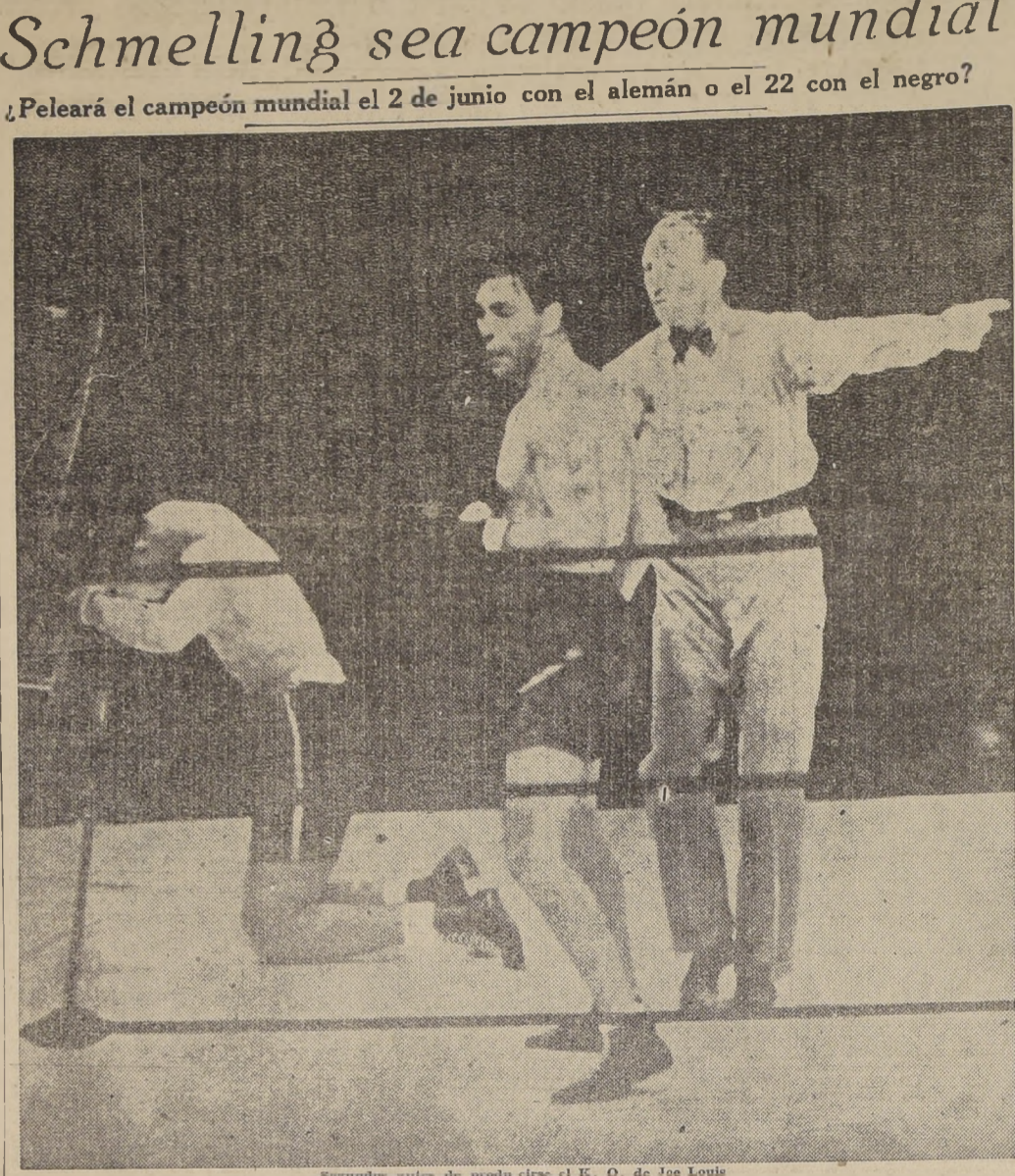
Segundos antes de producirse el K. O. de Joe Louis

Peleará el campeón mundial el 2 de junio con el alemán o el 22 con el negro?