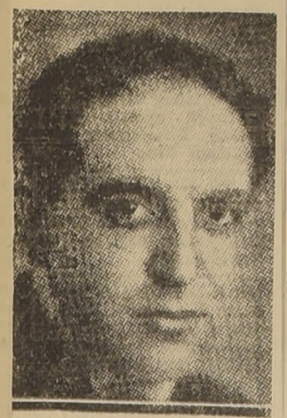
Dr. Gregorio Marañón, que se ha demostrado partidario de los nacionalistas