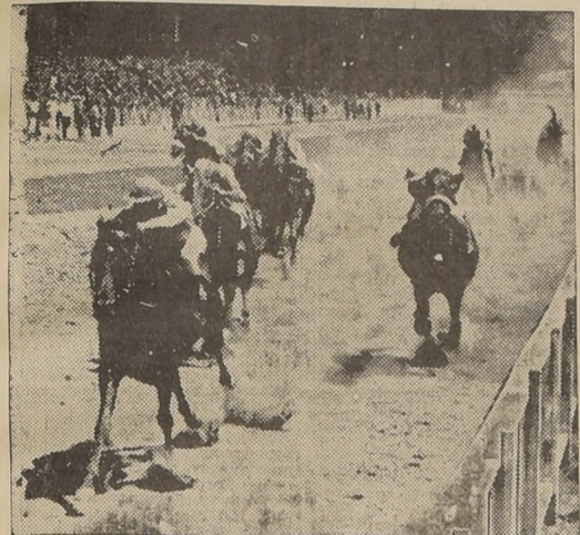
Pif Paf da cuenta de Hernán Cortés, Caramanchel y Levantisco en la sexta carrera.

trcientos metros corridos por de Mama Lucha, pasó rápidamente al frente perseguida por Clavelina, Quadrant, Khami Celestino y Estambul, ocupando los últimos lugares Amor Pagano y Puno.