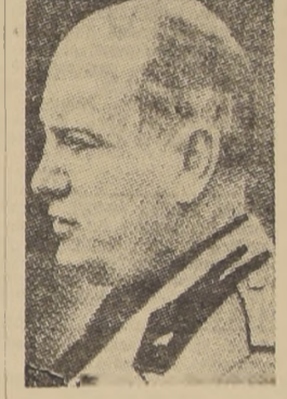
Mussolini que, con un Gran Consejo Fascista, estudiará el rearme de Inglaterra y Francia

El príncipe heredero, que tiene 21 años de edad, visitó Gran Bretaña en 1932, para retribuir la visita de la misión que, el año anterior, había asistido a la coronación de Haile Selassie.