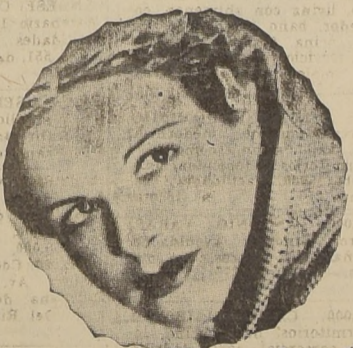
Dorita Zárate Notable cancionista argentina que este año vendrá a Chile para deleitar a nuestro público por el micrófono de Radio Baquedano.