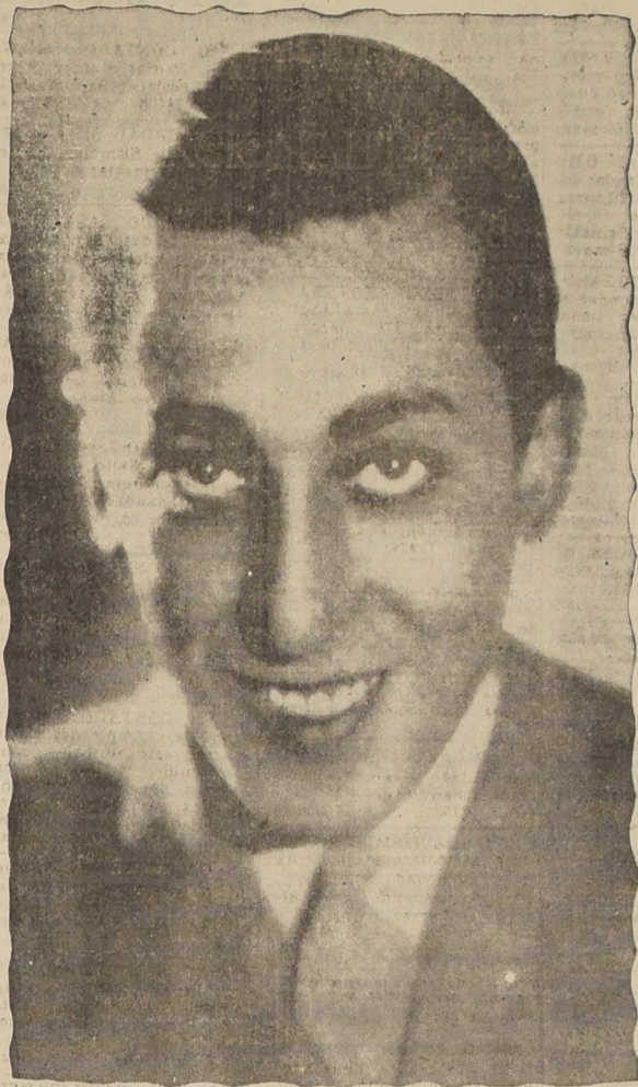
JULIO DE CARO

El distinguido maestro y compositor argentino, Director de la Orquesta Melódica Internacional de fama mundial, que al frente de su conjunto debuta esta noche en C. B. 118 Radio Baquedano, en las audiciones de gala que auspicia la CAJA DE CREDITO POPULAR.