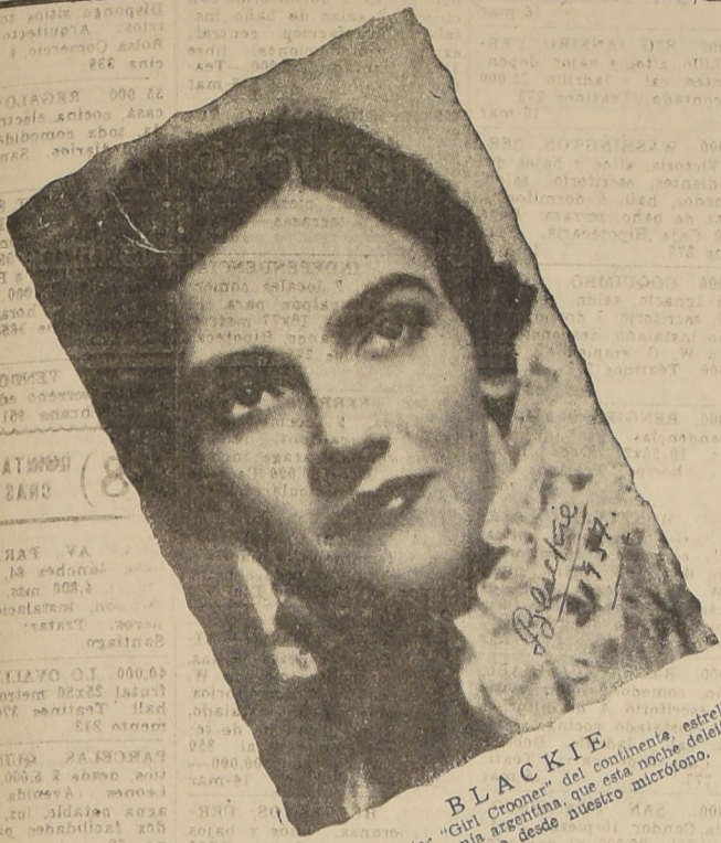
BLACKIE El mejor "Girl Crooner" del continente, estrella de la radiotelefonía argentina que esta noche deleita al público chileno desde nuestro micrófono.

LA GRAN ORQUESTA MELODICA INTERNACIONAL DE JULIO DE CARO DEBUTA HOY a LAS 21 Hrs. Brillantemente inicia esta prestigiosa broadcasting sus actividades radiales de 1937.-- Solicite en los estudios de Radio Baquedano el hermoso folleto con su elenco de 75 artistas.