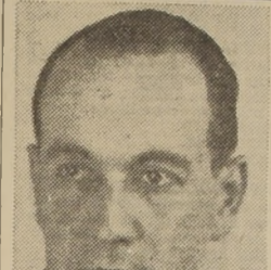
El Ministro del Trabajo, don Roberto Vergara Donoso, que presidirá el acto de hoy en Valparaíso.