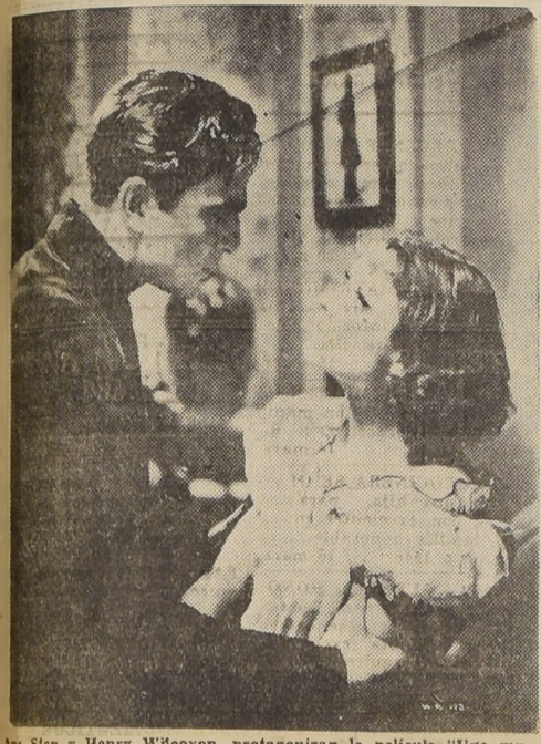
Ana Sten y Henry Wycoxon, protagonizan la película "Una mujer sola", que exhibe hoy la pantalla del Real

"UNA MUJER SOLA", ES EL ESTRENO DE HOY EN EL REAL