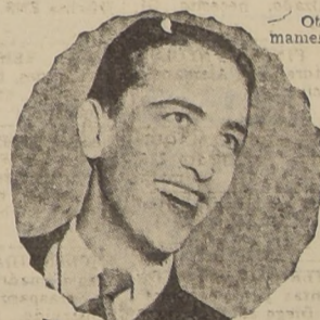
Hugo Del Carril El nuevo Gardel que en L. R. 1 Radio Baquedano de Buenos Aires ha sido consagrado como el más fiel intérprete del tango. Cantará este año en Radio Baquedano.

Otra estrella argentina, que realizará próximamente el elenco artístico de C. B. 118.