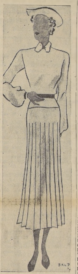
VERA BOREA. — Conjunto de lana amarillo mostaza. Cinturón de charol negro.