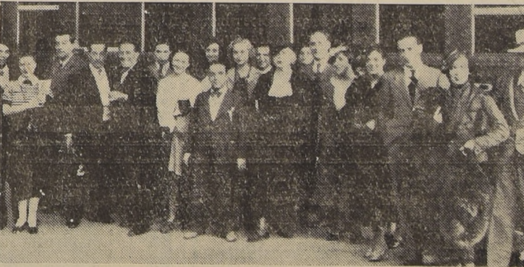
Los componentes de la Compañía de la actriz catalana Margarita Xirgú en el momento de llegar ayer en la tarde a la Estación Mapocho

Llegada de la Compañía de Margarita Xirgú a Santiago