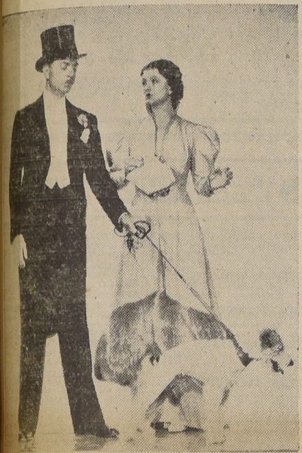
William Powell y Myrna Loy, con el famoso perro "Asta", protagonizan este nuevo film de Metro Goldwyn Mayer

"Genio y Figura" nuevo gran estreno del Metro