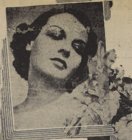
Culis suave y hermosa, sólo se obtiene usando el delicioso Salon FLORES DE PRAVIA MUSICA