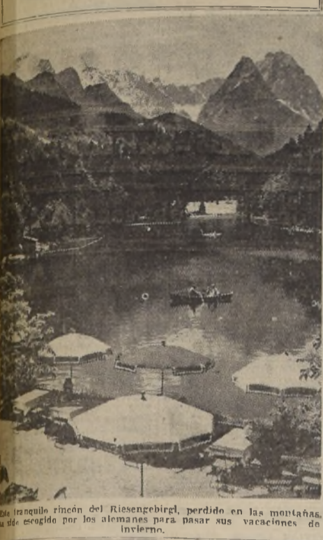
Este pequeño rincón del Riesengebirge, perdido en las montañas, ha sido escogido por los alemanes para pasar sus vacaciones de invierno.