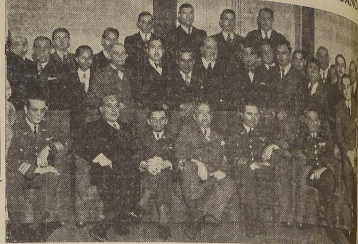
Grupo de asistentes a la recepción ofrecida ayer en el Club Peruano al comandante peruano...