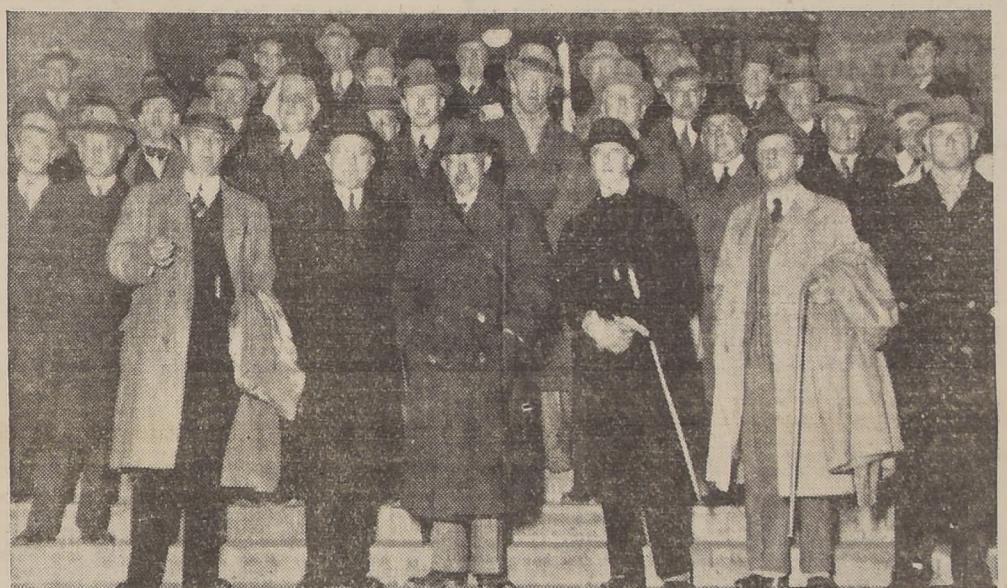
Los miembros de la misión comercial holandesa a su llegada anoche a la Estación Mapocho, acompañados de los representantes de nuestro Gobierno y de la Legación de Holanda