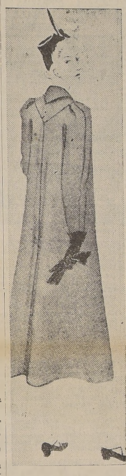
Abrijo amplio en lana fina, azul marino o negro.