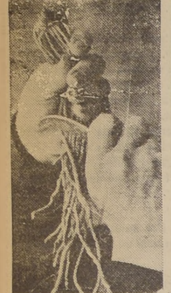
Se cortará el extremo de las raíces dejándoles una longitud uniforme de 15 cms.