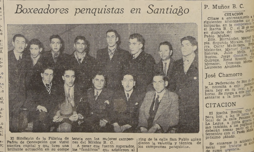
El Sindicato de la Fábrica de Paños de Concepción que visitó nuestra capital y que tuvo una brillante actuación en su competencia con los mejores campeones del México B. C. A pesar de fueron superados, los "fanáticos" que asistieron al ring de la calle San Pablo aplaudieron la valentía y técnica de los campeones penquistas.