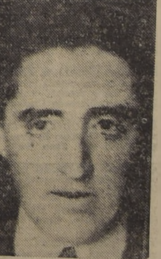
Don Juan Antonio Ríos, presidente del Partido Radical, cuyas declaraciones sobre la posición de la colectividad que dirige pueden dar nuevas orientaciones en el campo político.

En todos los pueblos conquistados por los nacionalistas, los vascos llevaron a cabo sus acostumbrados actos de destrucción. En los sitios que se desarrollaron las mayores luchas, hay montañas de cadáveres, que las brigadas sanitarias se encargan de enterrar apresuradamente.