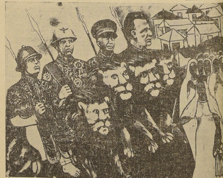
Fotografía de una pintura presentada en la Exposición Colonial de Roma, en la que se ven a los conquistadores de Etiopia, armados con lanzas y a lomos de leones. A la izquierda a derecha: Mussolini; el Rey de Italia; el general Badoglio y el general Graziari. La obra se debe al pincel de un artista etiope