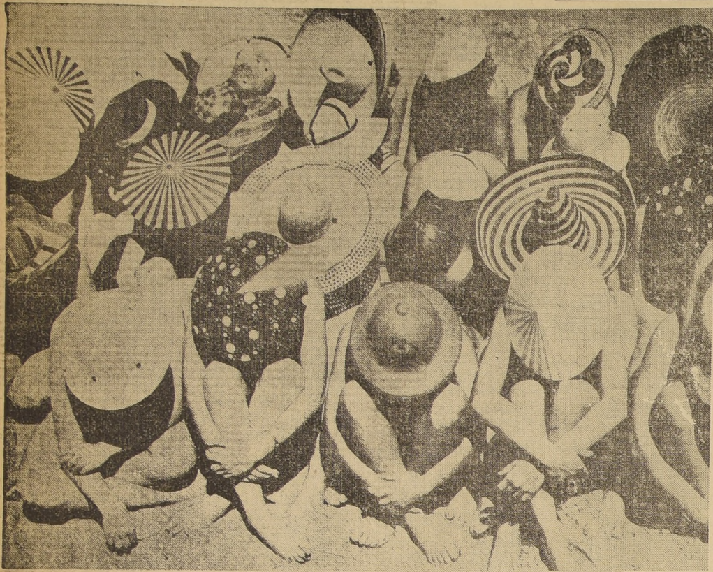
En Long Beach (EE. UU.) se hizo este conjunto de sombreros para representar a la Liga de las Naciones. En él figuran desde el alón mexicano hasta el coolie chino.