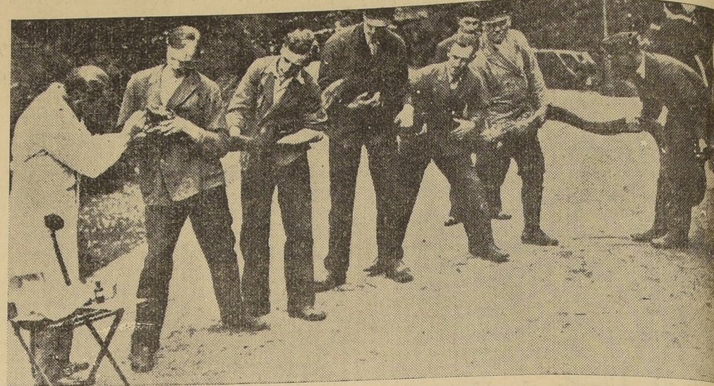
Un gran pitón del Zoológico de Rotterdam (Holanda), al que sujetan siete hombres, mientras un dentista (el hombre vestido de blanco), lleva a cabo una inspección en la boca de la serpiente