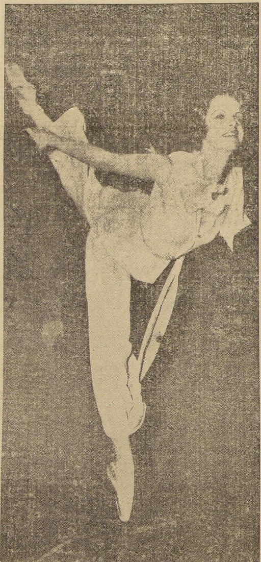
Una difícil actitud de Miss Hocter, ballarina norteamericana de ballet que va alcanzando grandes éxitos.