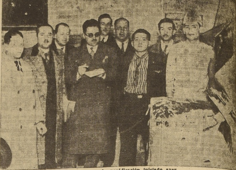
Asistentes al ensayo de panificación iniciado ayer.

Presenciaron las pruebas realizadas a petición de los obreros representantes de la Inspección del Trabajo y de la Dirección de Sanidad