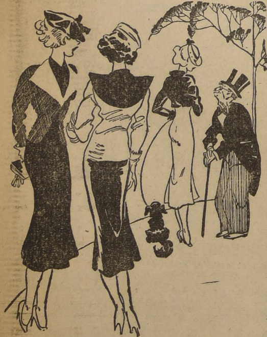
Se apellidan Demaria, pero ahora yo no sé si él es el padre, el abuelo o el marido...