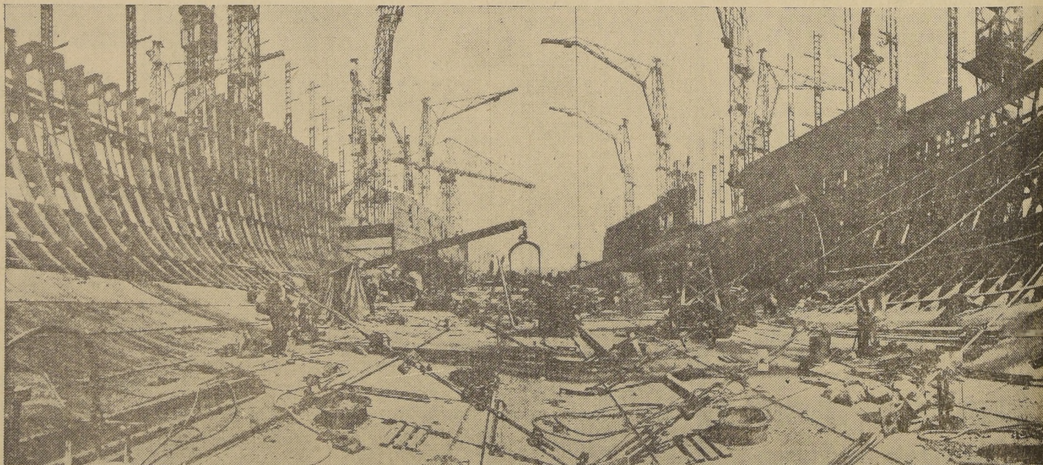
El encuadernamiento y los trabajos de construcción del "N.º 552", barco gemelo del "Queen Mary" que, posiblemente, será terminado el próximo año y que estará listo para el servicio entre Inglaterra y Norte América en el verano de 1940.