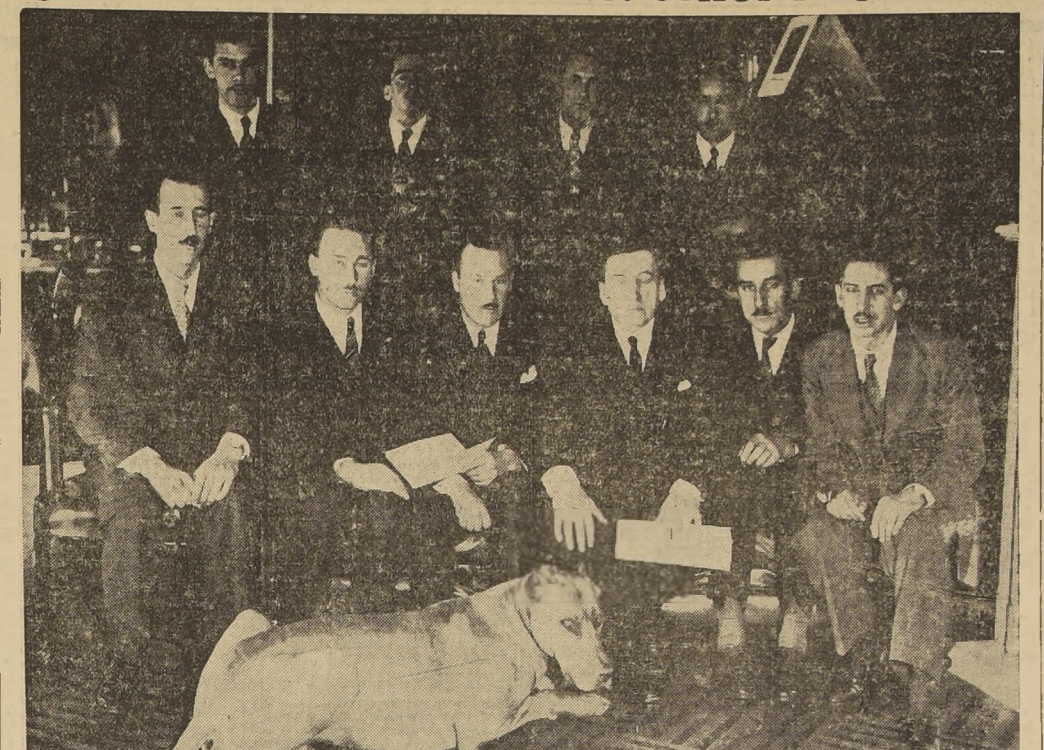
Ayer fué recibida en audiencia por S. E. el Presidente de la República, la delegación de estudiantes de la Facultad de Agronomía de la Universidad de Chile, que acaba de regresar de una larga gira por el Japón. Los estudiantes manifestaron a S. E. su agradecimiento por las facilidades que encontraron para realizar su viaje de estudio y lo informaron de los resultados que de él obtuvieron.