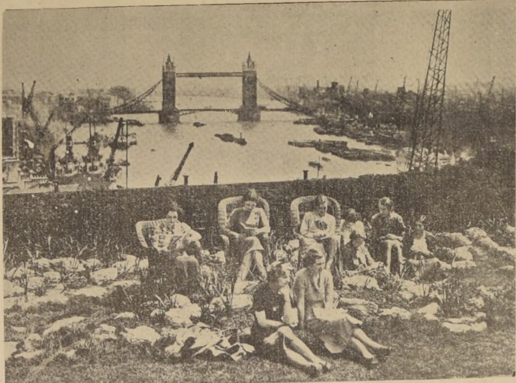
Estas muchachas, que trabajan en Adelaide House, cerca de London Bridge...