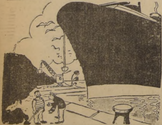
Tengan cuidado al cargar el carbón. Los otros días se quejó el comandante porque el carbón estaba lleno de pasajeros clandestinos.