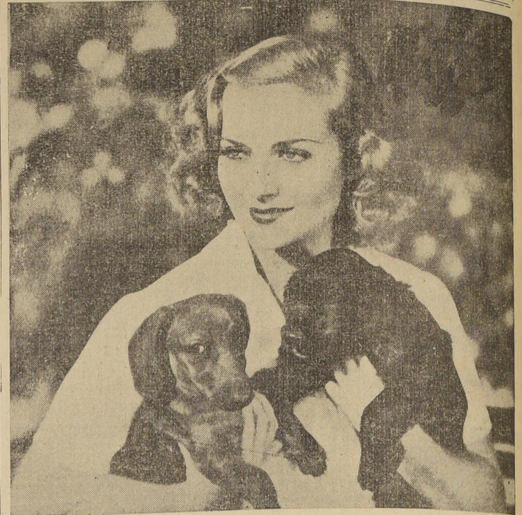
Esta hermosa actriz francesa parece comprender el alma compleja de los perros; los dos animalitos parecen querer imitar la dulce mirada de su ama.