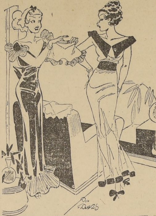
—¿Cual me pondre para ir a la pista de patinaje?