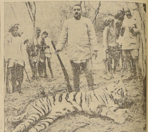
El Principe de Rajputana emplea sus días de ocio en el difícil deporte de cazador de tigres. Aquí aparece con una recién muerto por un certero tiro del Principe.