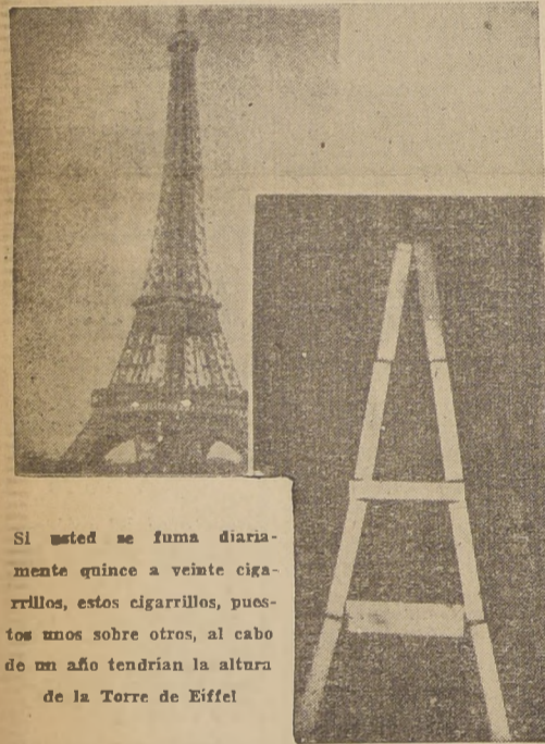
Si usted se fuma diariamente quince a veinte cigarrillos, estos cigarrillos, puestos unos sobre otros, al cabo de un año tendrían la altura de la Torre de Eiffel.