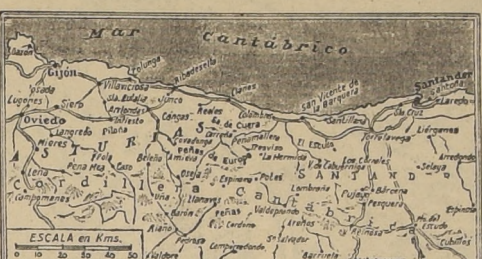
Zona de la costa cantábrica en tre Santander y Oviedo, por la cual tendrán que avanzar los nacionalistas para tomarse la provincia de Asturias y cuya caída Franco pronostica para dentro de un mes

Hay posibilidades de que aumente el rozamiento anglo-japonés y aún que se produzcan crisis diplomáticas con las otras naciones, que es lo que los chinos esperan con suma ansiedad