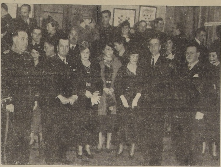
Grupo de asistentes a la recepción ofrecida ayer por la Dirección de la Academia de Guerra, con motivo de su 51.º aniversario, y a la cual asistieron el Ministro de Defensa Nacional, Adictos Militares extranjeros y altos jefes de las fuerzas armadas.