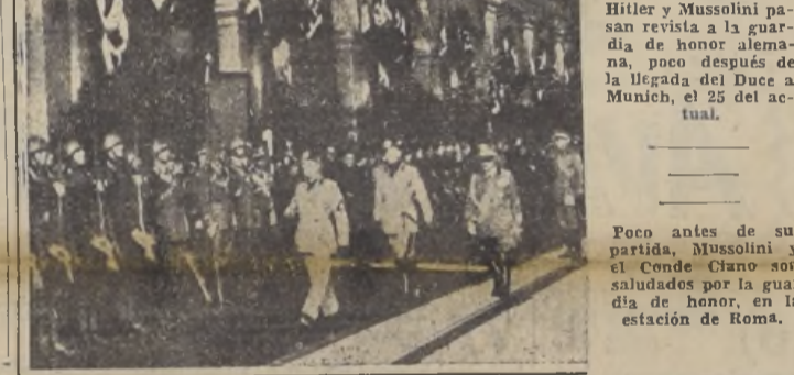
Poco antes de su partida, Mussolini y el Conde Ciano son saludados por la guardia de honor, en la estación de Roma.