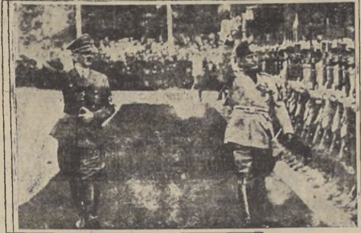
Hitler y Mussolini pasan revista a la guardia de honor alemana, poco después de la llegada del Duce a Munich, el 25 del actual.