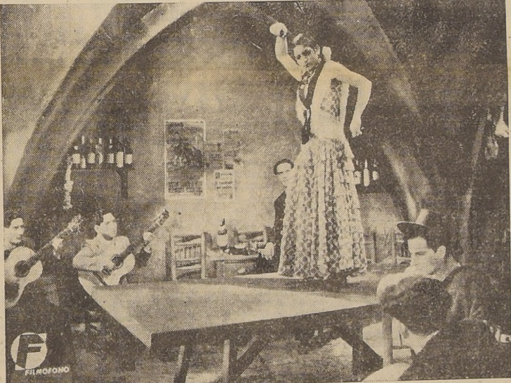
CARMEN AMAYA ha heredado el título de primera bailarina de España que ostentara "La Argentina". Triunfante en los escenarios de Buenos Aires...