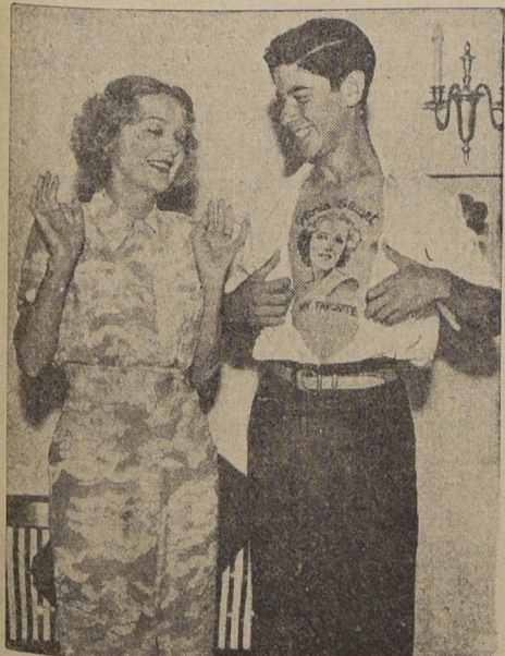
Un ferviente admirador de la artista de cine, Gloria Stuart, fue desde Chicago a Hollywood para llevar a la estrella un indeleble testimonio de su admiración.