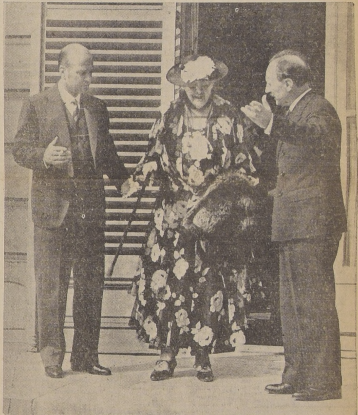
M. Camille Chautemps indica el parque del Hotel Malignon a la señora Roosevelt, madre del Presidente de los Estados Unidos, que fue recibida en la Presidencia del Consejo francés.