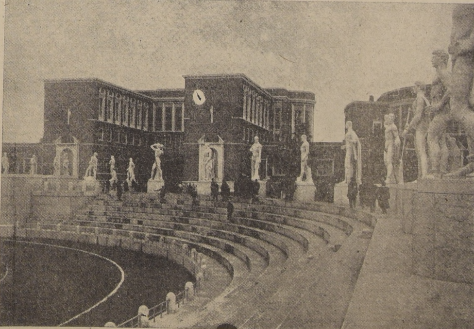
El estadio de mármol, donde se desarrollan las ceremonias y los cortejos patrióticos del Foro Mussolini, en Italia, centro de educación física y de exaltación moral.