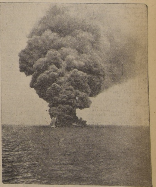
Esta fotografía fue tomada durante el hundimiento del petrolero "Campeador", que fue atacado por dos contratorpederos, los que después de intimarle su rendición, y como se negara a ello, dispararon sus armas contra el navío, que llevaba nueve mil toneladas de gasolina.