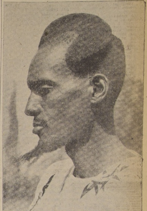
Este peinado está de moda entre los hombres de la tribu de Ruanda en Egipto. Las damas de Occidente tienen algo más que imitar en esta materia.