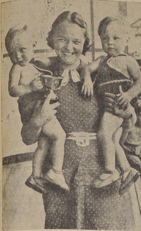
En un concurso realizado en una playa europea estos dos niños fueron premiados por su salud y belleza. ¿Quién no aprobaría la decisión del jurado?