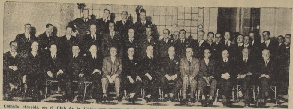
Comida ofrecida en el Club de la Unión con motivo de la celebración del campeonato de billa entre este Club y el de Viña del Mar, y que fué ganado por el equipo de Santiago.