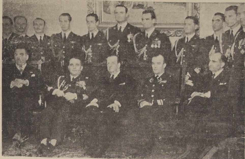
El Ministro de Defensa y la delegación de aviadores italianos que lo visitó ayer

Mañana serán recibidos en audiencia especial por S. E. el Presidente de la República. — Actividades de ayer de la misión aérea italiana. — Entrega de condecoraciones a los Edecanes de la Presidencia. — El festival aéreo del próximo 31