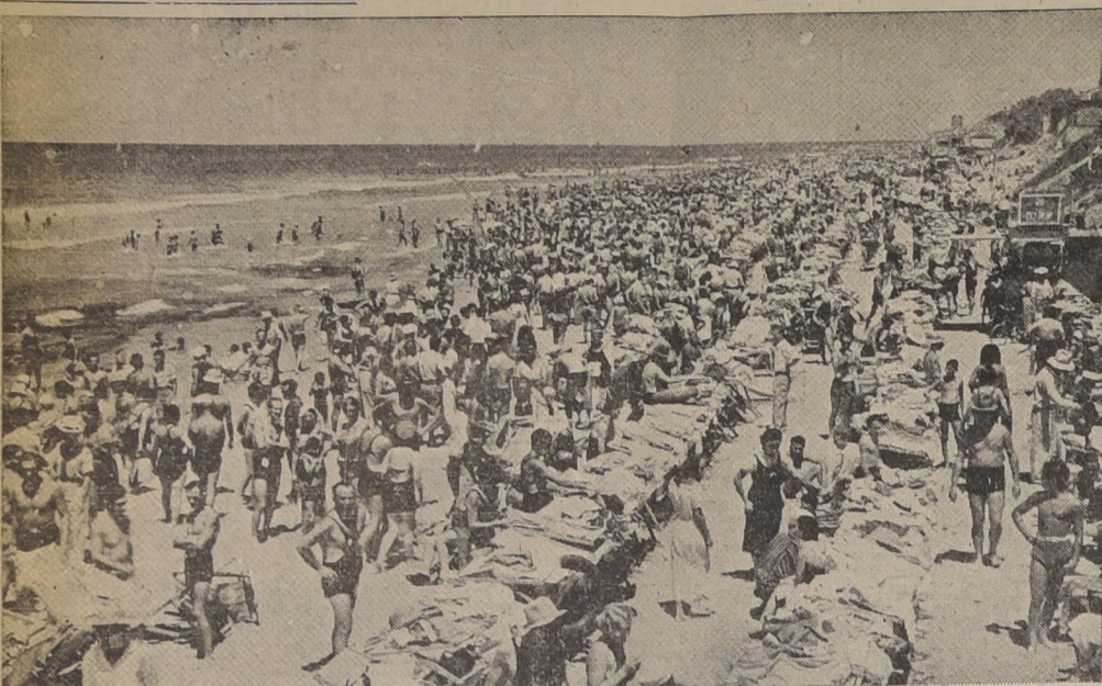
Mientras en toda Palestina los disturbios no cesan entre árabes y judíos, a raíz de las medidas tomadas por el Gobierno inglés, de dividir el territorio entre estados de nacionalidades, las playas de Tel Aviv se ven concurridas de veraneantes y banistas, que, olvidando el rencor político, se dedican al descanso y a la tranquilidad.