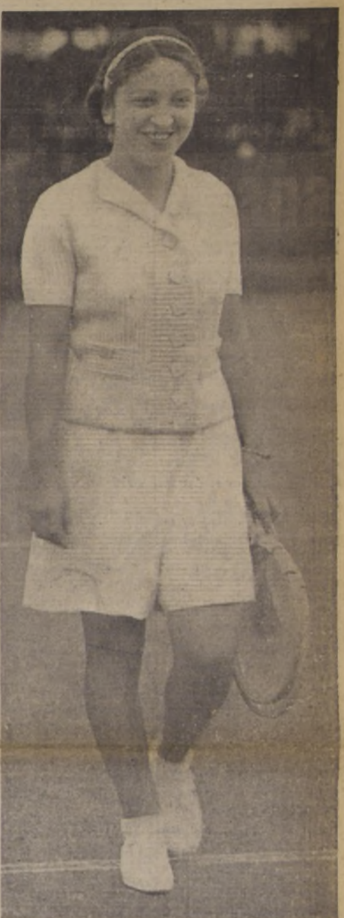
ANITA LIZANA, la primera jugadora del ranking mundial. Llegó esta tarde a Los Cerrillos trayéndose laureles deportivos no logrados hasta hoy en forma tan brillante y tan indiscutida por ningún deportista de Sud América. Y es por ello que Santiago entero se apresura para rendirle un homenaje que será un justo estímulo para esta gran campeona que tanto ha hecho por el nombre de Chile