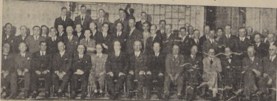
Asistentes al banquete ofrecido en el Club de la Unión por los ingenieros argentinos

A esta manifestación asistieron más de doscientas personas.— Visita a los paseos de la ciudad.— Ayer los ingenieros visitantes se dirigieron a Valparaíso