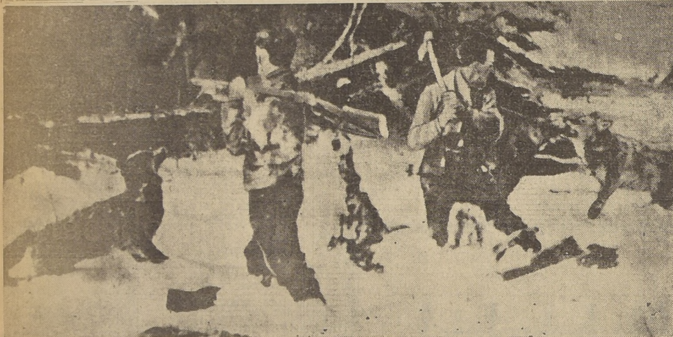
Estos cazadores fueron atacados por una banda de lobos hambrientos cerca de Sudbury, en el Canadá. Terminadas sus municiones, tuvieron que defenderse con las armas como si fueran mazas. La fotografía fue tomada por un tercer miembro de la partida, que en seguida disparó sobre las bestias, malando a tres de ellas y haciendo huir al resto de la manada.