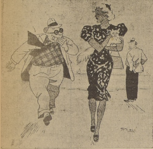
¿Cómo me gustaría estar en lugar del zafiro? ¿De veras? Lo llevo donde el veterinario.