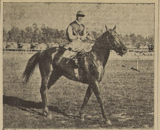
En estos momentos se tramita la venta de El Mago para Venezuela, en la suma de 120 mil pesos.