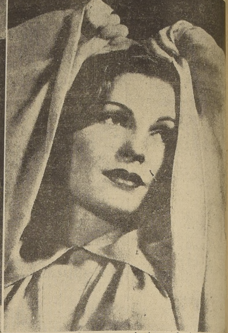
A la izquierda: El maestro del maquillaje toma las medidas necesarias antes de comenzar la tarea de transformar el rostro de esta señorita por uno más fotogénico y también más hermoso. (A la derecha). Terminada la obra, una nueva cara ha nacido. Tan distinta, que parece no ser la misma.