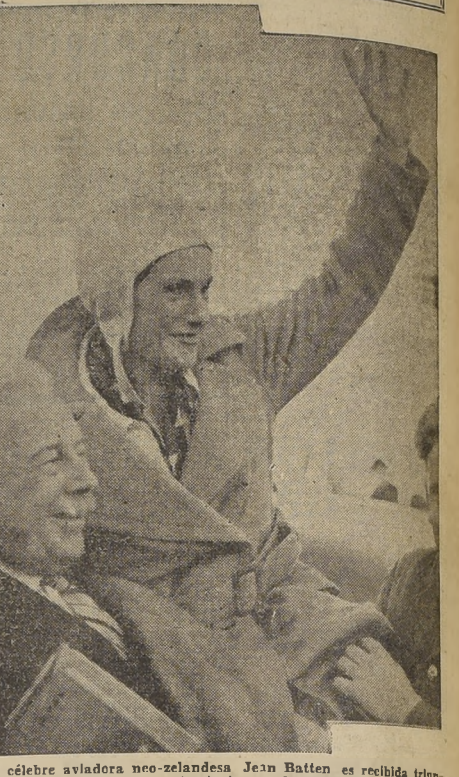
La célebre aviadora neo-zelandesa Jean Batten es recibida triunfalmente después de su aterrizaje en el aeropuerto de Lymington