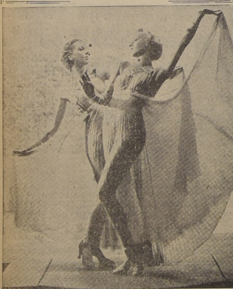
Estas dos bailarinas del Merriell Abbott Girls están siendo la sensación del mundo artístico de Londres por su nueva concepción de la danza