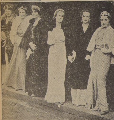
Foto grupo de parejas de Inglaterra espera sus automóviles después de una reunión de gala. Entre ellas se ven la Condesa de Stanhope, Lady Claude Hamilton y Lady Greenwood