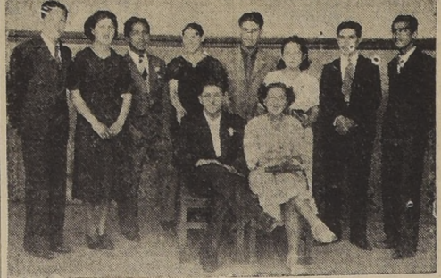
La "Mejor Compañera" y el "Mejor Compañero" de la Escuela para Obreros y Empleados Benjamin Franklin, elegidos últimamente, rotados de los "Buenos Compañeros" de cada curso