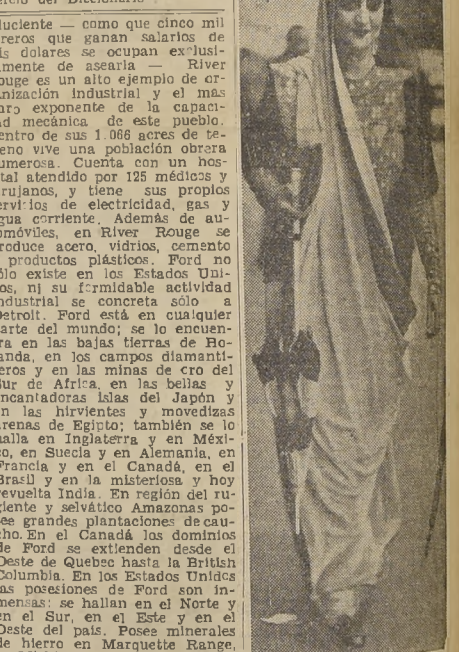
Las damas inglesas de la tal sociedad en su visita a la India, adoptan generalmente el tipo típico, haciéndolo, naturalmente elegante que el que habitualmente se lleva en aquella colonia

En ante Morelet estaba pensionado en Francia, para trabajar en un "Diccionario del Comercio" del cual en treinta años no había publicado más que el prospecto. No hace el "Diccionario del Comercio" de París — sino el "Comercio del Diccionario"