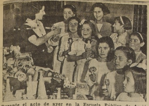
Durante el acto de ayer en la Escuela Pública de Acción Social