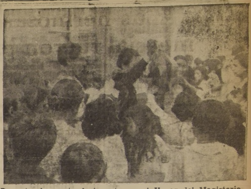
Durante el reparto de juguetes en el Hogar del Magisterio, organizado por el Comité de Defensa del Niño