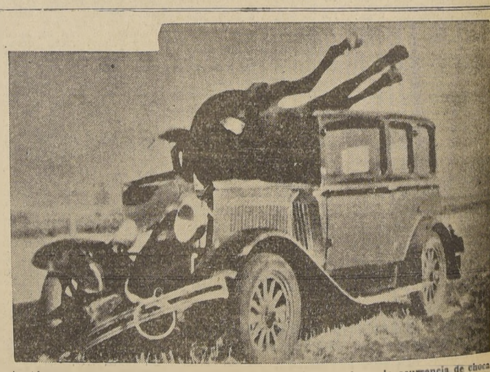
Instantánea tomada en el momento en que un caballo tuvo la mala ocurrencia de chocar a un automóvil en un camino de Saskatoon, en el Canadá. El caballo resultó muerto, y los ocupantes del auto con heridas leves.

RETENCION a la orina mejora rápidamente con OBLEAS "MELY" (A base Urotropin Comp.) En venta: Droguería Francesa, Santiago.