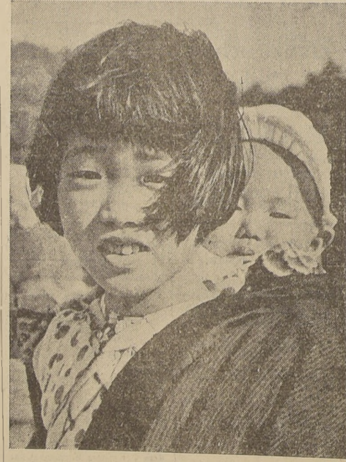
Una joven esposa y madre, del Japón lleva su niño a la espalda, como era la costumbre en el antiguo Imperio nipón.