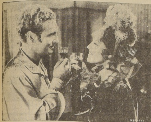
Jeanette MacDonald con Allan Jones, principales protagonistas de este nuevo film que se presentará, por primera vez en Sud América, en el Teatro Metro de nuestra capital.