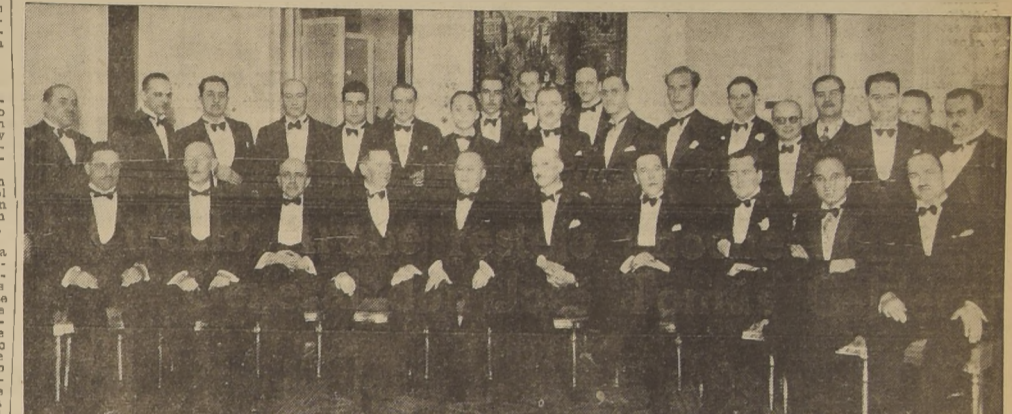
Asistentes a la manifestación ofrecida anoche, en el Circulo Arabe, en honor del general salvadoreño, don José Tomás Calderón, presidente honorario del Circulo Libanes en su patria, como una muestra de simpatía por las actividades del festejado en favor de la colonia árabe en la República de El Salvador