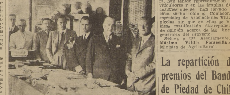
Durante la inauguración de la exposición de productos checoslovacos.

Asistieron el Encargado de Negocios de ese país, el Subsecretario de Comercio y numerosos invitados.— Los muestrarios