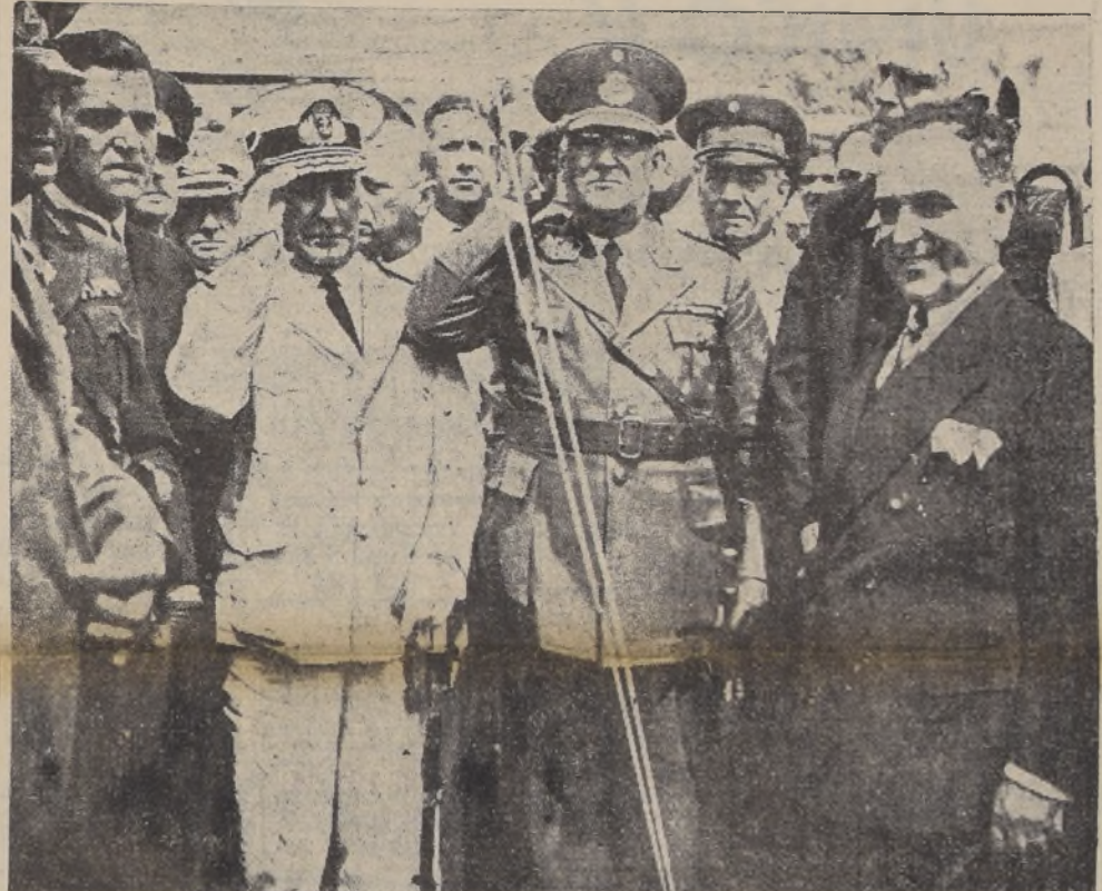
Los Presidentes Justo (de uniforme obscuro, al centro) y Vargas (de civil al extremo derecho), durante la celebración de las diversas ceremonias con que se efectuó la inauguración de los monolitos del puente internacional en Paso de los Libres. En este grabado aparece la mayor parte de las personas muertas en el accidente de aviación del domingo

Las primeras noticias de la catástrofe fueron recibidas casi a medianoche; las autoridades ordenaron inmediatamente que escuadras de salvamento se dirigieran al sitio