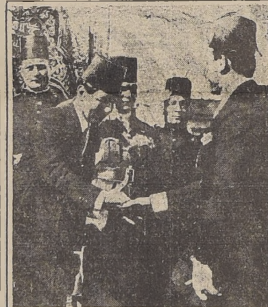
El nuevo primer ministro de Egipto, Mohamed Mahmud Hajj, extrae la mano al Rey Farouk, quien relevó por él al primer ministro anterior, Nafiz Hajj.