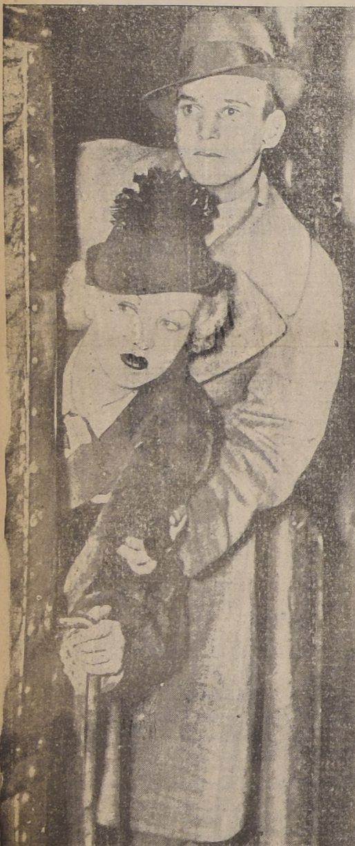
Jackie Coogan y Betty Crable, su reciente esposa. Como los lectores pueden ver, hay una gran diferencia entre el muchachito de la película "El Pibe" y el actual marido.