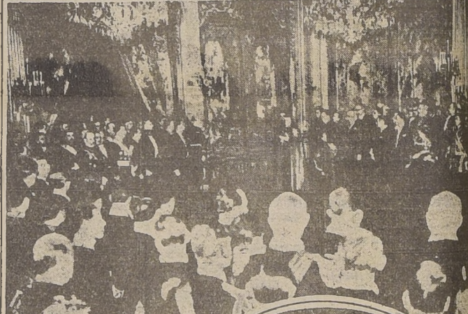
La recepción oficial ofrecida por el presidente de Francia, M. L. Abbas, con motivo del fin de año, en el Palacio de los Campos Elípticos.