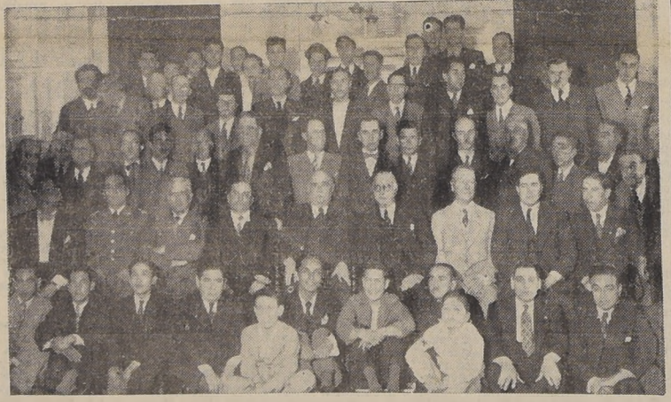
Asistentes al banquete en honor de don Rafael Torres Ibieta

Especales caracteres adquirió el banquete que los trabajadores manuales e intelectuales de Valparaíso ofrecieron en honor del Ministro Plenipotenciario de nuestro país ante el Gobierno de Colombia, señor Rafael Torres Ibieta.