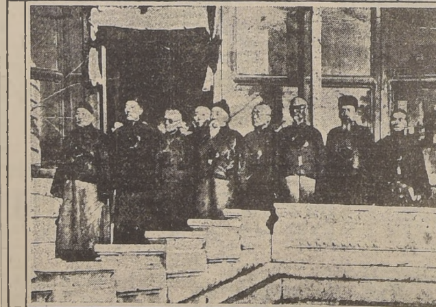
El nuevo gobierno chino formado en Peking, bajo el dominio japonés, se reúne por primera vez en el Palacio de la Beneficencia.