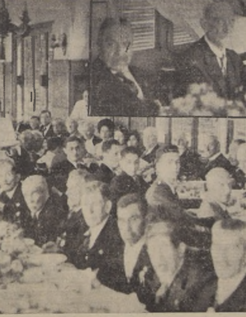
Mesa de honor y parte de los asistentes al almuerzo con que el Club Hípico festejó ayer a los veteranos del '79, acto con que se iniciaron las festividades del "Día del Veterano", que se celebra hoy en todo el país. (Infor. pag. 15)