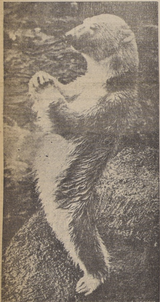
Casi están demás todos los comentarios acerca de este oso que toma una actitud bien aristocráticamente premeditada ante la máquina fotográfica