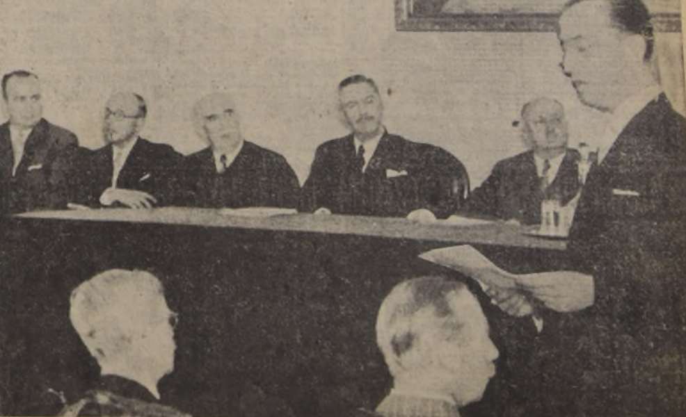
Mesa directiva del homenaje de ayer, en el cincuentenario de la muerte de don Miguel Luis Amunátegui. — El Recorrido de la Universidad leyendo su discurso. — (Información página 12)