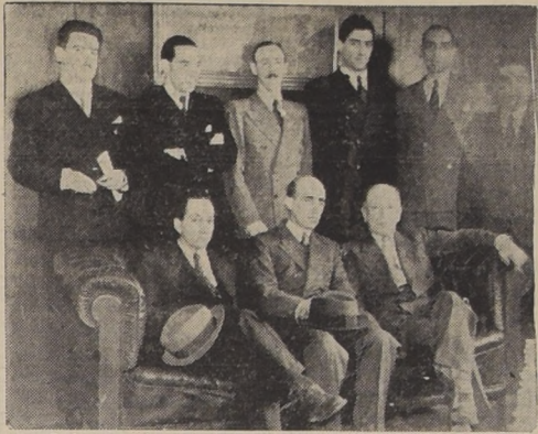
Quinquela Martin, durante su visita de ayer a la Dirección de "LA NACION"

Habla, entre muchas otras cosas, de la necesidad de un intercambio artístico chileno-argentino