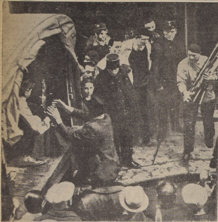
La policía francesa, durante uno de los numerosos allanamientos a las guardias de los "cagoullards" hace una recolección de armas