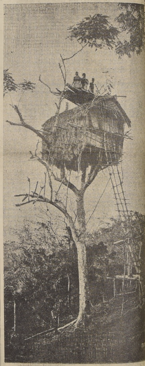
Nativos de Nueva Guinea se fabrican estas curiosas viviendas, a las cuales suben por una larga escalera, que puede subirse, son bastante ventiladas

La sal marina, pues, obra como el papel fundamental del mar en el veneno. Es un hecho. Es la posición mineral del mar, que demuestra elocuentemente el fenómeno de la vida.