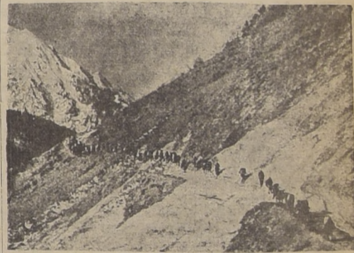
La expedición alemana al Himalaya atravesando una gigantesca moraina por una estrecha vereda bordeada de precipicios. Fotografía llegada por el correo aéreo de "Air France".

La expedición alemana al Himalaya, dirigida por Martin y Pfeiffer, terminó con una catástrofe en las escarpadas laderas del Nanga Parbat, en la noche del 13 al 14 de junio de 1937. Un formidable alud sorprendió a los audaces alpinistas cuando trataban de vencer terribles pendientes a 6.000 metros de altura. Todos los europeos que componían la expedición y nueve guías indígenas quedaron sepultados bajo la nieve. Un solo hombre, el Dr. Luft, logró salvarse y dar la alarma. Después de varios días, Luft pudo volver al lugar de la catástrofe. Fue necesario remover grandes masas de hielo y nieve. Después de penosos esfuerzos, aparecieron los primeros cuerpos de los desgraciados exploradores. Entre los objetos que se encontraron junto a los caídos estaban las películas y fotografías tomadas durante la trágica ascensión. Esos documentos acaban de llegar a Alemania, en donde han sido reproducidos en los principales diarios. Damos a conocer a nuestros lectores algunas de esas fotografías llegadas por el correo aéreo de la Air France, y que fueron publicadas en el diario "Paris-Soir" el domingo.