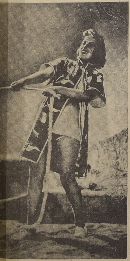
Un tapado de playa de seda azul con motivos marinos, banderas, yates, gaviotas, estampados en sus colores naturales sobre un traje de seda "elástica" de reciente aparición en EE. UU. Mocasines de tela con suela de goma.