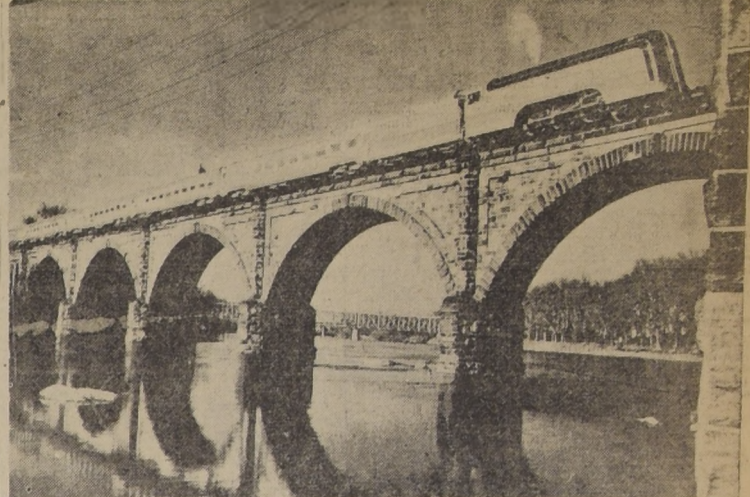
El tren aerodinámico, compuesto por cinco coches que ahora hace dos viajes diarios entre New York y Filadelfia, se ve aquí cruzando el puente sobre el río Schuylkill. Hace exactamente cien años se inauguró esta línea, ahora perteneciente al Reading Railway System.