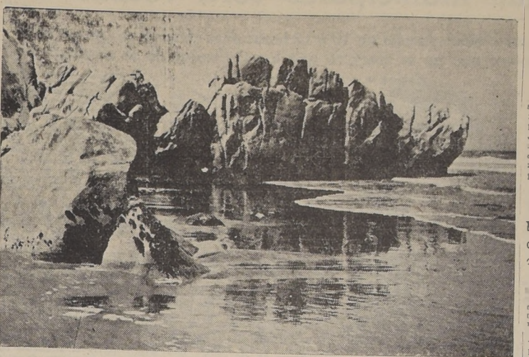
Playa de Santo Domingo

Se encuentran ubicadas a dos kilómetros de la estación de Llole y 105 kilómetros de Santiago