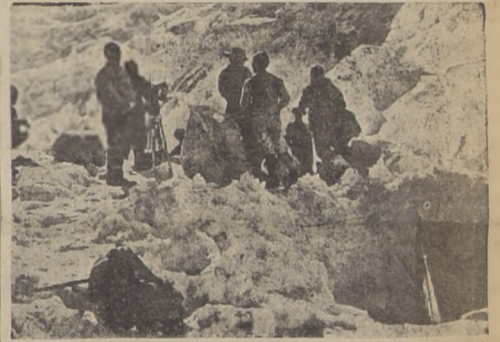
Los alemanes en el campamento No 4, la víspera de su muerte.