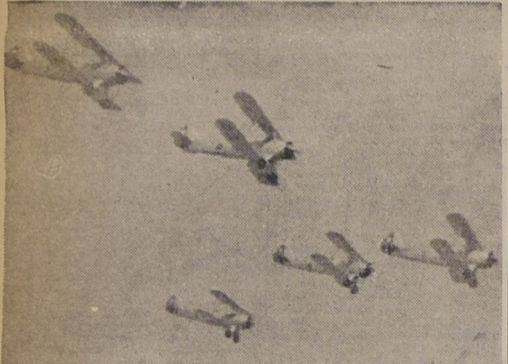
Un aspecto de la presentación aérea de ayer en "El Bosque"

A las 10 horas de ayer se efectuó en el campo militar de aviación de "El Bosque" la prueba oficial de los aviones Focke Wulf de Escuela, ante el Ministro de Defensa Nacional y el Comandante en Jefe de la Fuerza Aérea, general don Diego Arce.