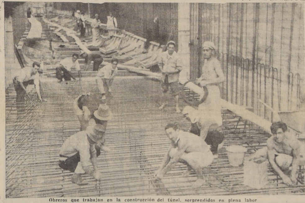
Obreros que trabajan en la construcción del túnel, sorprendidos en plena labor