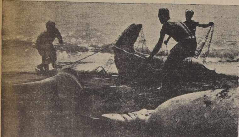
Pescando elefantes marinos en la isla de Guadalupe, Baja California, para el zoológico de San Diego-Cal.