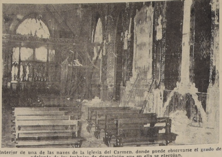
Interior de una de las naves de la iglesia del Carmen, donde puede observarse el grado de adelanto de los trabajos de demolición que en ella se efectúan.