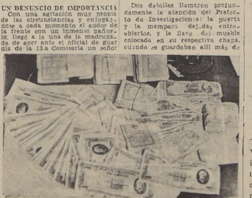
Los billetes del presunto robo de $ 90.000, en Investigaciones

La Prefectura de Investigación, de Santiago tuvo que intervenir ayer en uno de los más curiosos casos de simulación de robo que se han presentado en los últimos tiempos, logrando esclarecer en menos de 8 horas la verdadera situación presentada. Lo extraordinario del caso se funda, en primer lugar, en el monto de la cantidad presuntamente desaparecida, que asciende a más de noventa mil pesos, y en segundo, a la calidad de una de las personas que interviniere. Los detalles llamaron profundamente la atención del Prefecto de Investigación: la puerta de la casa de la señora X, que se encontraba abierta, y la llave del mueble colocada en su respectiva charca, cuando se guardaban allí más de