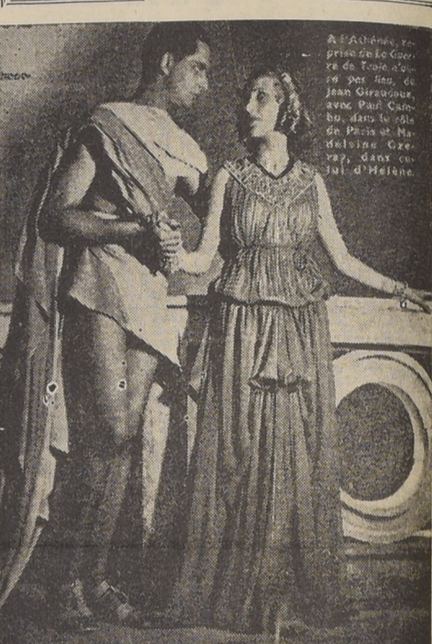
En el Teatro del Ateneo de París se ha reestrenado con gran éxito, la obra de Jean Giraudoux, "La Guerra de Troya no tendrá lugar"...