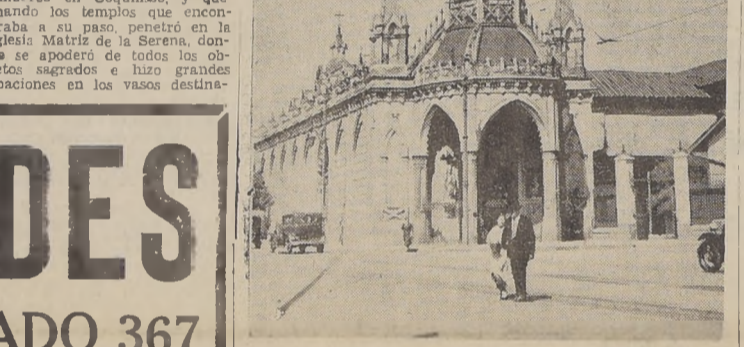
La Iglesia del Carmen, fundada hace 247 años, que está actualmente en demolición.