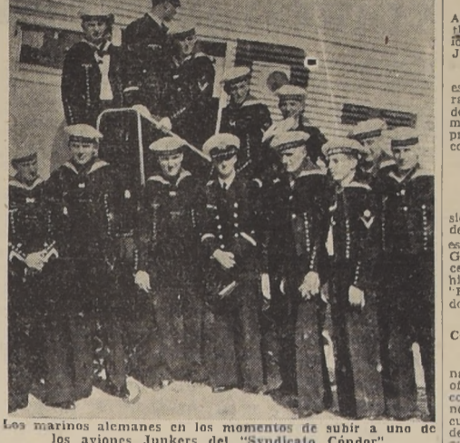
Los marinos alemanes en los momentos de subir a uno de los aviones Junkers del "Sindicato Condor"

Con motivo de la visita a nuestra capital de los marinos del "Schlesien", la Compañía de