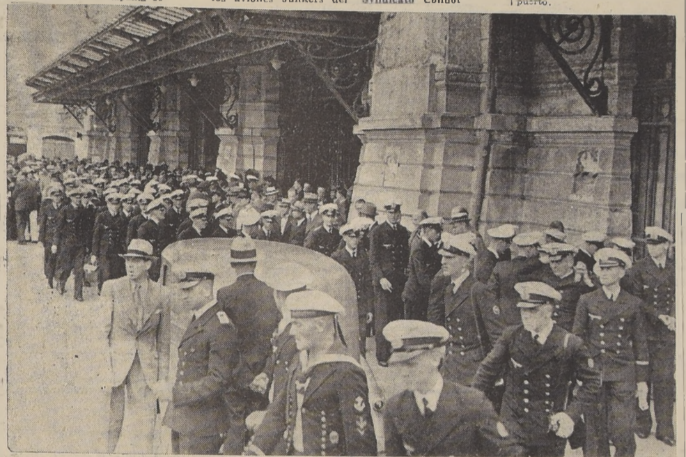
El curso de guardiamarinas del "Schlesien" a su llegada a la Estación Mapocho.

El Ministerio de Defensa Nacional, don Emilio Bello Codesido, ofrecerá el jueves próximo un cocktail en honor de los marinos alemanes en Las Salinas, al cual asistirán, además, autoridades civiles y militares del vecino puerto.