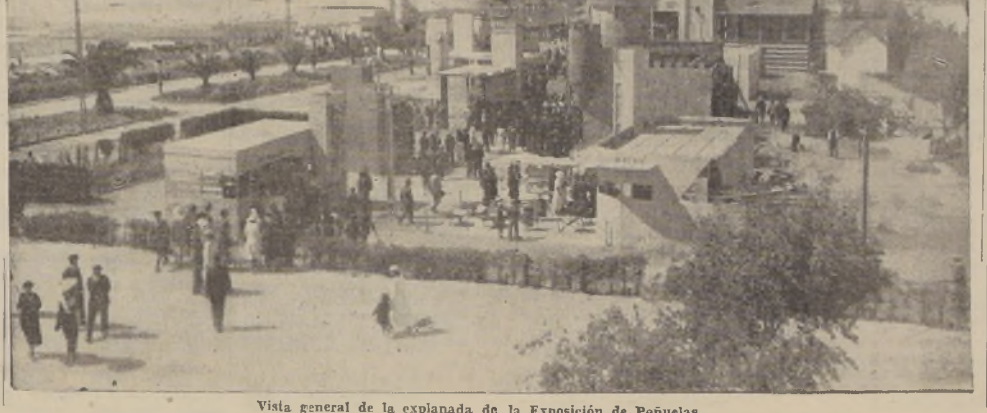
Vista general de la explanada de la Exposición de Peñuelas