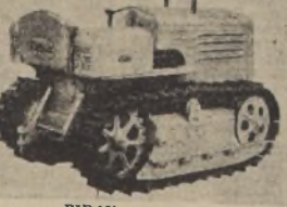
PIDAN DATOS A:

International Machinery Co. SANTIAGO: VALPARAISO: Huérfanos 1189, Cas. 107-D - Edificio GRACE, Cas. 90 - V