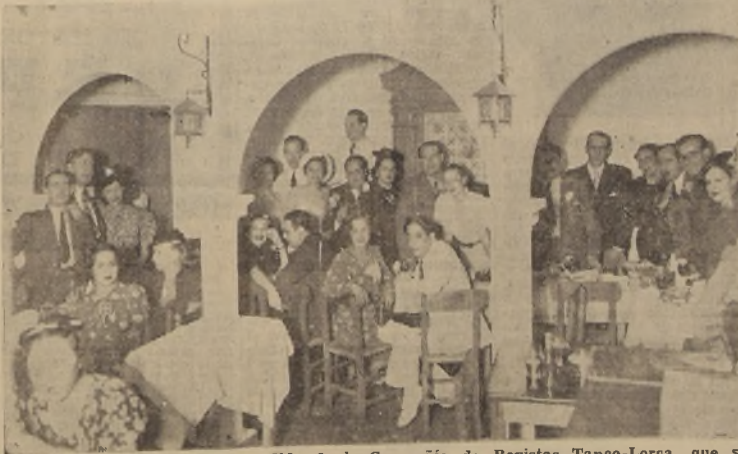
Asistentes a la comida de despedida de la Compañía de Revistas Tanco-Lorca, que se efectuó en el "Patio Andaluz"

Noche a noche el TEATRO CAUPOLICAN agota sus localidades con las exhibiciones de la hermosa película típica mexicana "LA CASITA", una maravilla de color y armonía, donde se escuchan las hermosas canciones: "Adiós mi Chaparrita", "La Casita", "El Caporal", "Las Cuatro Milpas" y otras.