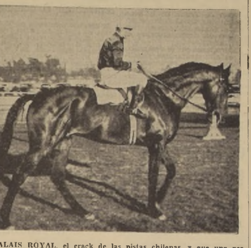
PALAIS ROYAL, el crack de las pistas chilenas, y que una vez más puede salir airoso, en el más difícil de sus compromisos