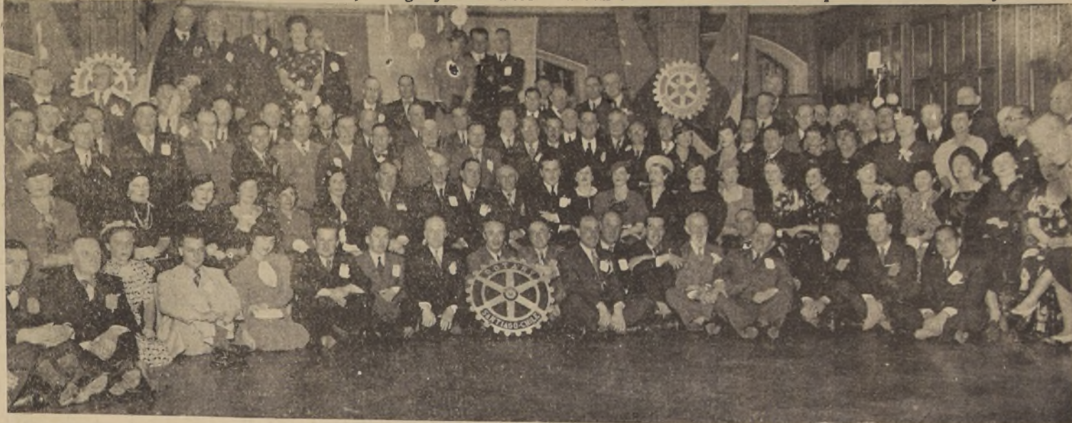
Asistentes a la comida de mutuo conocimiento, anoche en el Tea Room de Gath y Chaves