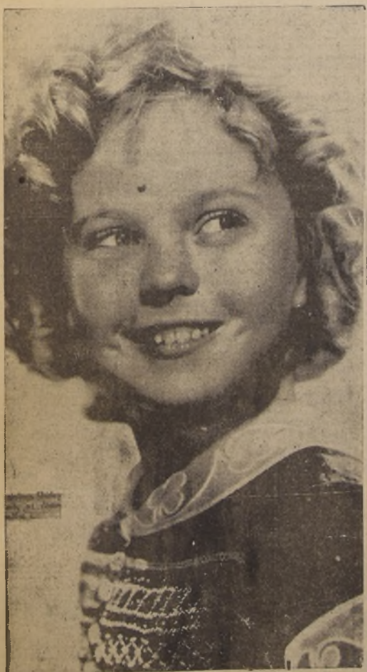
La pequeña Shirley Temple, ídolo de todos los niños del mundo, cuya villa sufrió los efectos de la inundación. La pequeña gran "estrella" cinematográfica, debió trasladarse a otros sitios junto con sus padres, ocasión que aprovecharon los bandoleros para saquear la casa; como también la de otros artistas de Hollywood