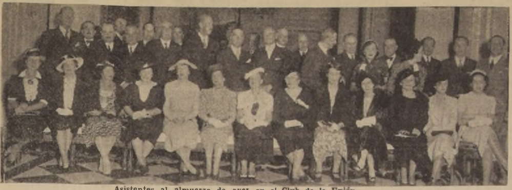
Asistentes al almuerzo de ayer en el Club de la Unión