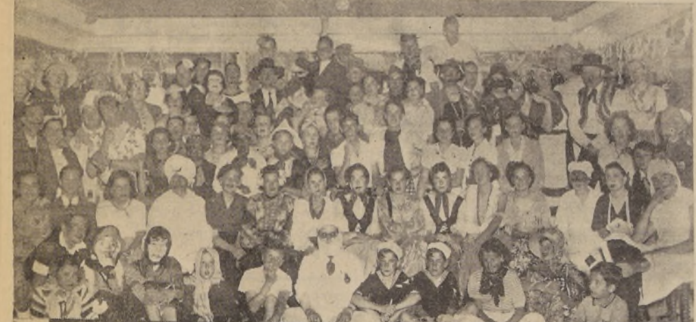
Asistentes al baile de fantasía realizado en el Hotel Pacifico, con motivo del término de la temporada veraniega en el Balneario de Algarrobo.