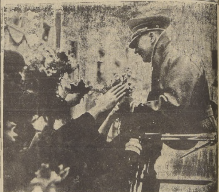
El Canciller Hitler es recibido por la población de su pueblo natal de Braunau Am Inn, en Austria. Sus compatriotas femeninas acuden a llevarle flores en manifestación de simpatía.