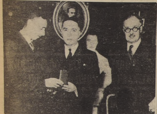
El señor de Beausse recibe del Canciller señor Gutiérrez la condecoración "Al Mérito" en presencia del Ministro de Francia

El Barón de Beausse recibió las insignias de la Orden al Mérito en el grado de Comendador