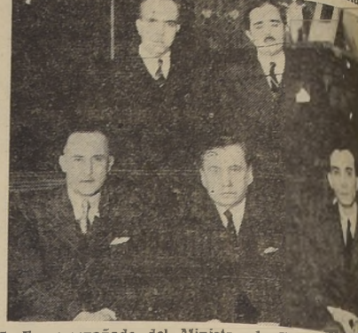
S. E. acompañado del Ministro de Venezuela y de las de este país que lo visitaron ayer

También pasaron a presentar sus saludos al Ministro de Defensa Nacional