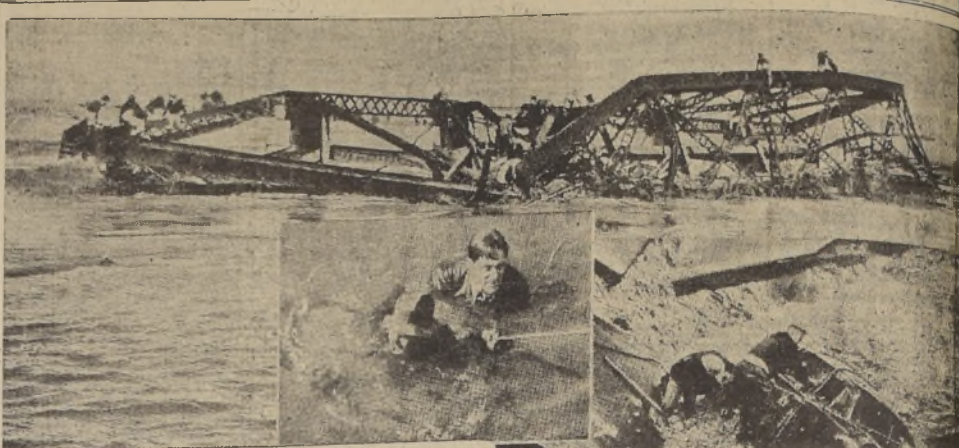
Arriba: El gran puente de acero que cruza el rio de Los Angeles a Bell es arrastrado por las aguas corrientosas.— Al centro: Una escena del salvamento en la ciudad inundada.—Abajo: Una verdadera ola de fango arrastra dos automóviles en un puente en Del Mar.