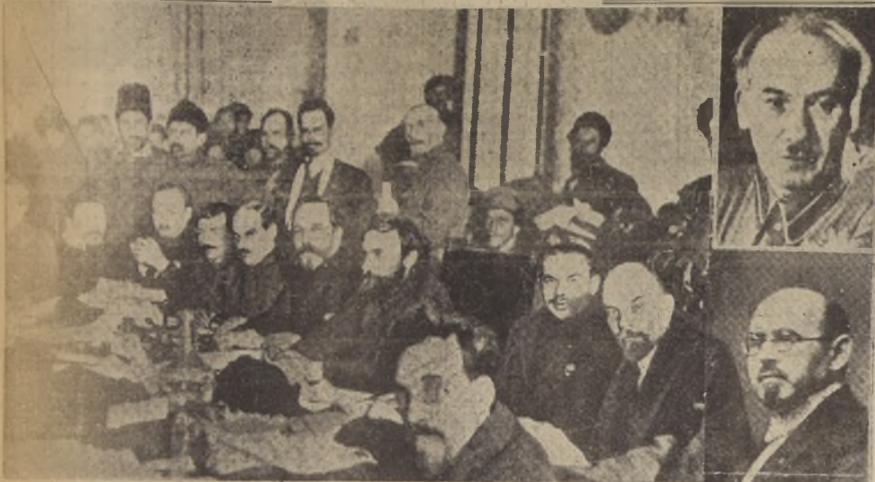
He aquí un grupo de dirigentes soviéticos del cual van quedando ya muy pocos. Se trata de una reunión del buró del partido comunista ruso en 1920. Sentados de izquierda a derecha: Yenoukidze (ejecutado), Kalinine, Boukharine (ejecutado), Stalin, Lachevich (desaparecido), Kamenev (ejecutado), Preobrajenski (ejecutado), Serebriakov (ejecutado), Lenine, Rykov (ejecutado). A la derecha, Yagoga y Krestinsky, condenados en el proceso último