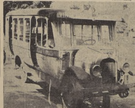
Uno de los autobuses que hace el servicio entre Valparaíso y Viña del Mar

en pleno centro de la ciudad, con un ruido en el suelo o con el motor descubierta en el cual el chofer busca afanosamente donde está la falla. Los grabados que acompañamos a esta información, comprueban esta afirmación, y reafirman que los vehículos son realmente antiguos.