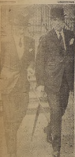
Mr. Eden y Lord Halifax abandonan juntos el Ministerio de Relaciones Exteriores después que este último se ha hecho cargo de su puesto