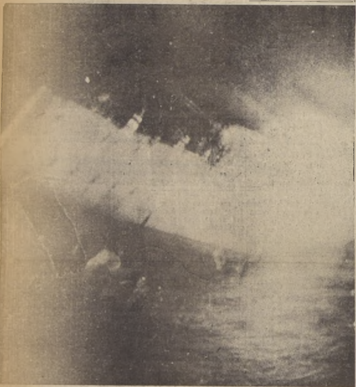
El "Balaers", buque insignia de la escuadra nacionalista española se hunde, envuelto en llamas, frente a las costas de Cartagena, después del combate sostenido con la flota del Gobierno. Por un momento la popa se levanta fuera del agua dejando ver el timón y las hélices. En cubierta los marinos se agrupan esperando el salvamento de parte de los barcos ingleses que acudieron al combate; en el agua algunos marinos de la tripulación tratan de alejarse a nado. (Fotografía llegada por el correo aéreo de ayer de la Air France)