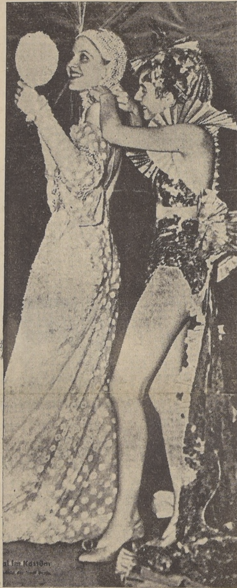
Durante un entreacto teatral las artistas, como buenas camaradas, se ayudan en los detalles de la toilette. Por supuesto que la de la derecha no necesita cuidarse mucho, y tampoco le hace falta