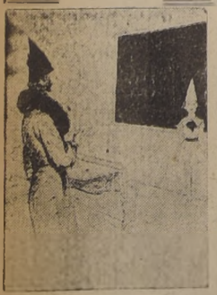
—Vamos, niña, quítese ese cucuracho ridículo.