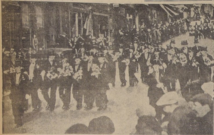
Alegres, los jóvenes de Villefrance, en la Riviera, celebran el día en que han sido llamados a prestar sus servicios en el ejército francés