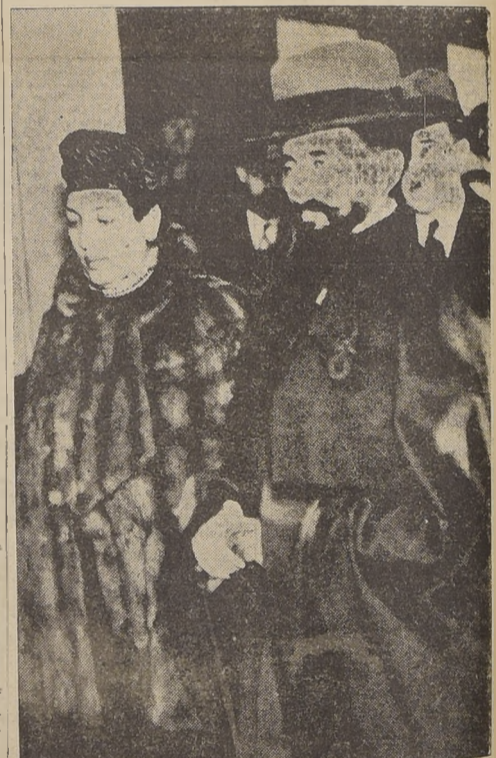
Sombrio, el exilado Emperador de Etiopía, abandona Londres y parte para Jerusalén en compañía de su esposa, que también demuestra su tristeza