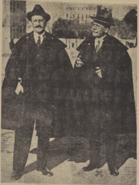
Los hermanos Alvarez Quintero. A la derecha (señalado con una cruz), Serafín.

Los nacionalistas con la zona de Chert (Castellón) se encuentran sólo a 20 kms. del Mediterráneo. . . . . 11 Cooperación y más unión entre los pueblos americanos se buscó en la conferencia del lunes en el Brasil. . . . . 10 En el departamento de Santiago, la Derecha obtuvo 67 regidores y 80. Partidos de Izquierda, 42. . . . . 13 Farley hizo un llamado por radio a toda la nación, es decir, a "todos los hombres de buena vo-