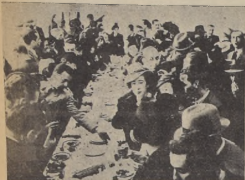
Parte de la concurrencia que asistió ayer a la inauguración del Teatro Alcazar, en los momentos de servirse el cocktail ofrecido por la Empresa.

Ayer ha sido inaugurado el nuevo Teatro Alcazar, elegante sala de espectáculos ubicada en la Plaza Brasil y que ha venido a ornamentar con una moderna obra arquitectónica, este barrio residencial de Santiago. El nuevo teatro es propiedad de la Caja de Previsión de Empleados del Salitre y está concebido para su explotación a la conocida empresa cinematográfica Italo Chilena.