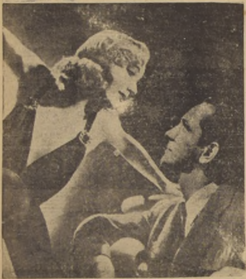
—'Y pensar que te vas a morir'— dice Carole Lombard a Frederick Marsh, en esta bella escena de la cinta 'Un suicida feliz', que acaba de filmarse.