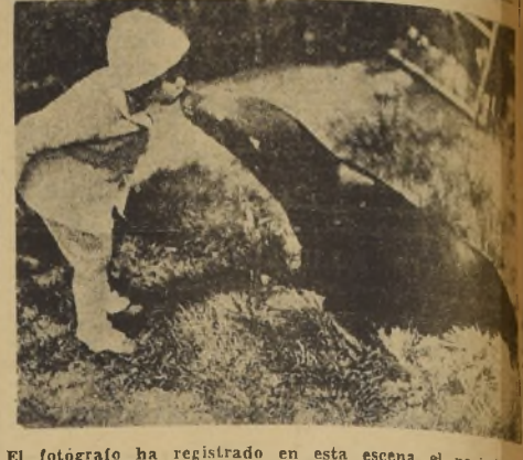
El fotógrafo ha registrado en esta escena el nacimiento de una sincera amistad entre esta joven foca del Zoo de París y una pequeña visitante, que seguramente la promete volver a menudo.