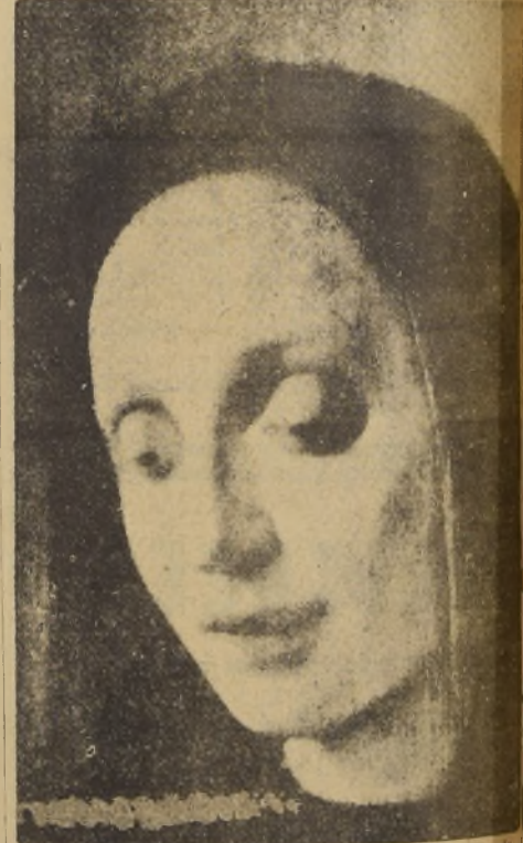
'Los Discipulos de Emmaüs' se llama esta obra maestra de pintura holandesa, del pintor Vermeer de Delft, que acaba de ser adquirida para el Museo de Rotterdam en once millones de francos. Lo curioso es que esta obra permaneció, hasta hace algunos meses, sin marco, abandonada en un rincón de la casa de una familia holandesa que vivía en París, y que no supo, hasta que un entendido hizo el descubrimiento, lo que valía el cuadro en referencia. (De 'L'Illustration', de París, llegado por correo de la Air France)