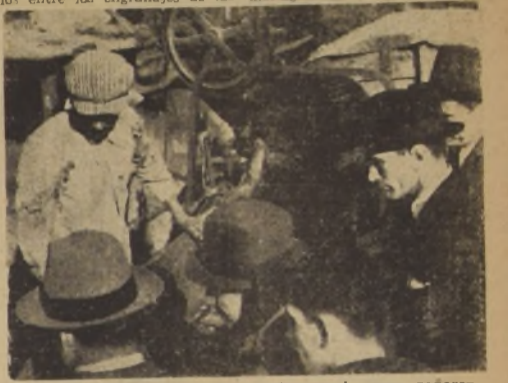
El Ministro del Trabajo y funcionarios que lo acompañaron presenciando la demostración del sistema.

La Sección Accidentes del Trabajo de la Caja Nacional de Ahorros se ha venido preocupando desde hace mucho tiempo de la serie alarmante de accidentes que se producen en los fundos, en las faenas de picadura de pasto. Al efecto, el número de accidentes en estos trabajos está aumentando cada vez más y en las últimas semanas han sido más de quince los obreros que han perdido sus miembros entre los engranajes de las