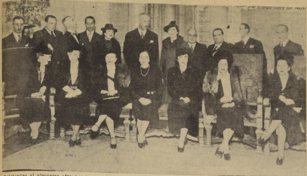
Asistentes al almuerzo ofrecido ayer, en la Legación de Bolivia, en honor del Ministro del Portugal y señora de Pedroso, con motivo de au-

sentarse próximamente a Europa. Fueron comensales: El Embajador de Inglaterra, Sir Charles Bentinck; don Ma-