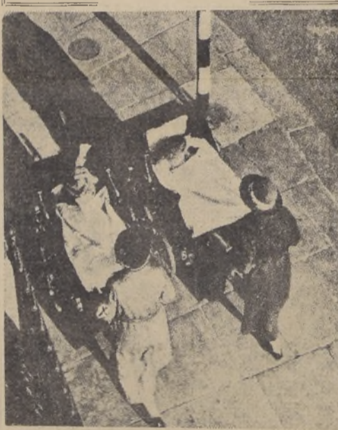
El Príncipe Edward y la Princesa Alexandra, hijos del Duque y la Duquesa de Kent, salen a tomar su paseo matutino cotidiano.