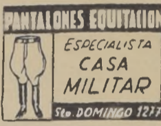
PANTALONES EQUITACION ESPECIALISTA CASA MILITAR