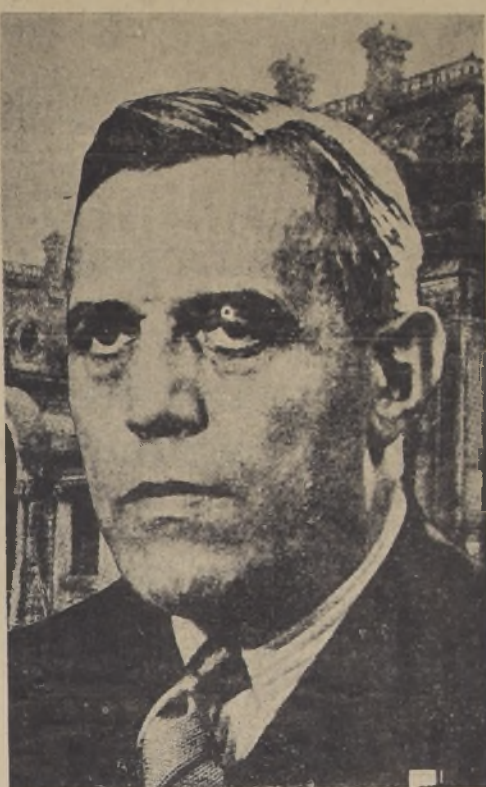
Excmo. señor don José María Cantilo.