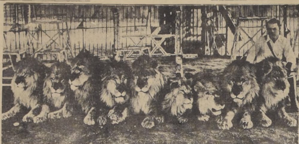
Terrell Jacobs, domador de fieras norteamericano, ha merecido, no porque haya escogido él, el título, sino porque el público se lo ha puesto, el calificativo de "Rey de los Leones". Jacobs trabaja en el Baley Circus, que se ha inaugurado en el Madison Square Garden, y aparece aquí, posando junto con sus "juguetes" en el interior de la jaula, donde luego les hará ejecutar sus pruebas.