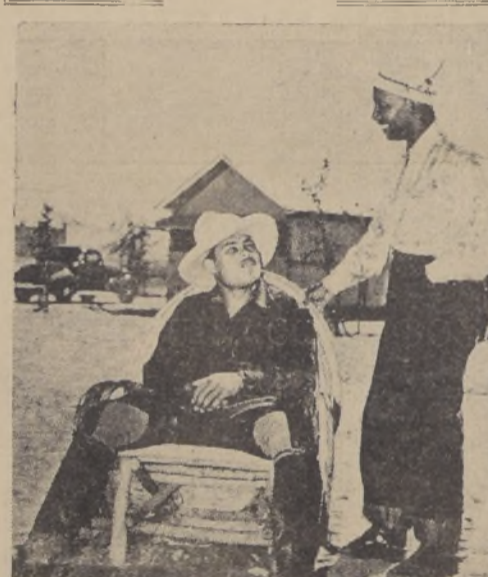
Joe Louis, que está entregado por entero a su entrenamiento para su próxima pelea con Max Schmelling, estima que la vida del campo contribuye mucho a mantenerlo en perfectas condiciones. Aquí lo vemos de cow-boy, descansando un poco, después de haber galopado durante algunos minutos, en el rancho de su propiedad.