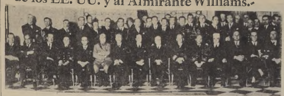
Asistentes al almuerzo ofrecido ayer por el Ministro de Defensa en el Club de la Unión