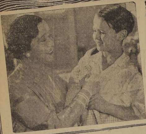
ADEMAS: LA SUPER "COLUMBIA" CREACION DE IRENE DUNNE Y GARY GRANT