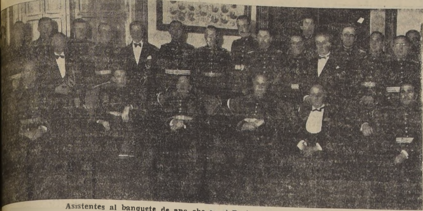
Asistentes al banquete de anoche en el Regimiento "Tacna".

Se celebró ayer con un torneo deportivo para la tropa.— Hoy el Ayudante del Comandante dará una conferencia sobre la participación de la unidad en la campaña del Pacífico