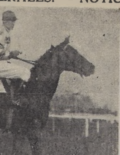
KUROKI EN LA SEGUNDA