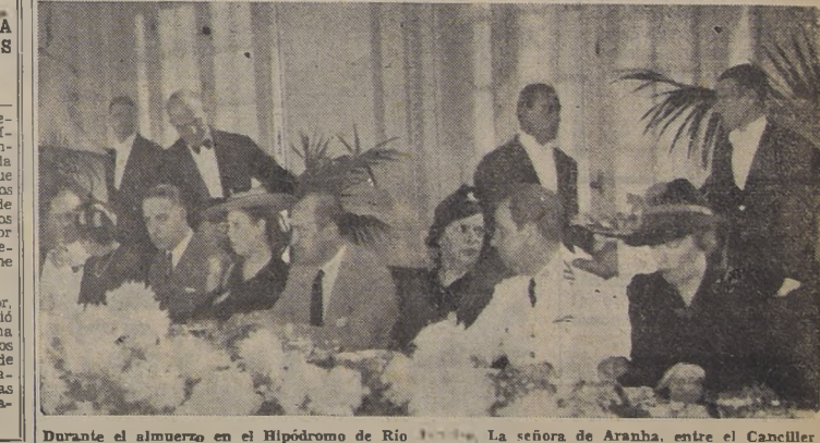
Durante el almuerzo en el Hipódromo de Río de Janeiro. La señora de Aranha, entre el Canciller y el Embajador de Chile

LONDRES, 26.—(U. P.)—El Subsecretario del Ministerio de Interior, Mr. Geoffrey Lloyd, informó a sus colegas, en la sesión de la Cámara de los Comunes, que en caso de emergencia, todos los niños de las escuelas de Gran Bretaña serán provistos de máscaras contra gases por el Gobierno, que podrán llevar a la escuela en un estuche especial. El Ministro de Interior, Sr Samuel Hoare, anunció que se está organizando una comisión de parlamentarios para examinar la cuestión de la evacuación por la población civil de Londres y otras ciudades, en los casos de ataques aéreos.