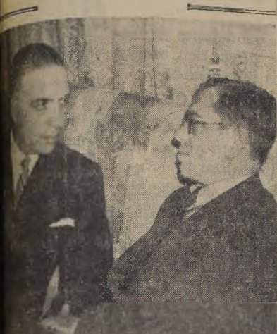
Un chileno durante un momento de conversación con el Ministro de Justicia brasileño