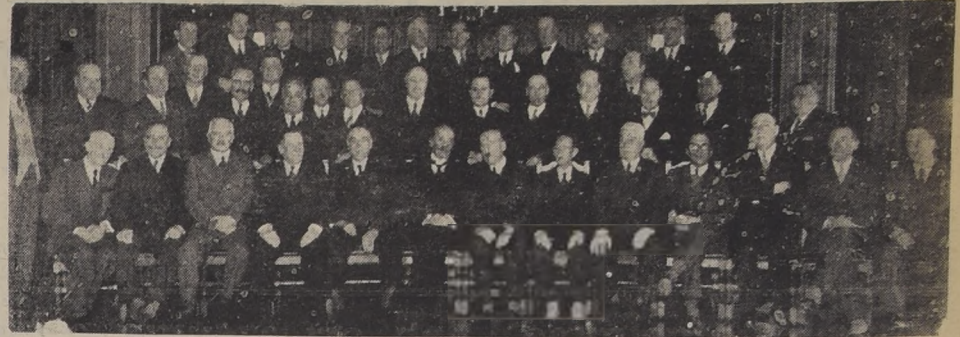
Los ex oficiales del Regimiento "Tacna" que se reunieron ayer en un almuerzo en el Tea Room de Gath y Chaves

El Regimiento "Tacna" celebró ayer con diversos actos el 121.º aniversario de la fundación de dicha unidad militar. A las 10 horas, hubo formación de la tropa con el objeto de oír la conferencia sobre la Batalla de Tacna y la participación que le cupo al Regimiento en la Campaña del Pacífico, que