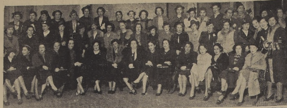
Ex alumnas del Liceo N.º 1 de Niñas de Santiago asistentes a la reunión efectuada anteayer en dicho establecimiento, durante la cual se dictó una conferencia de extensión cultural y se sirvió un té en honor de las visitas.