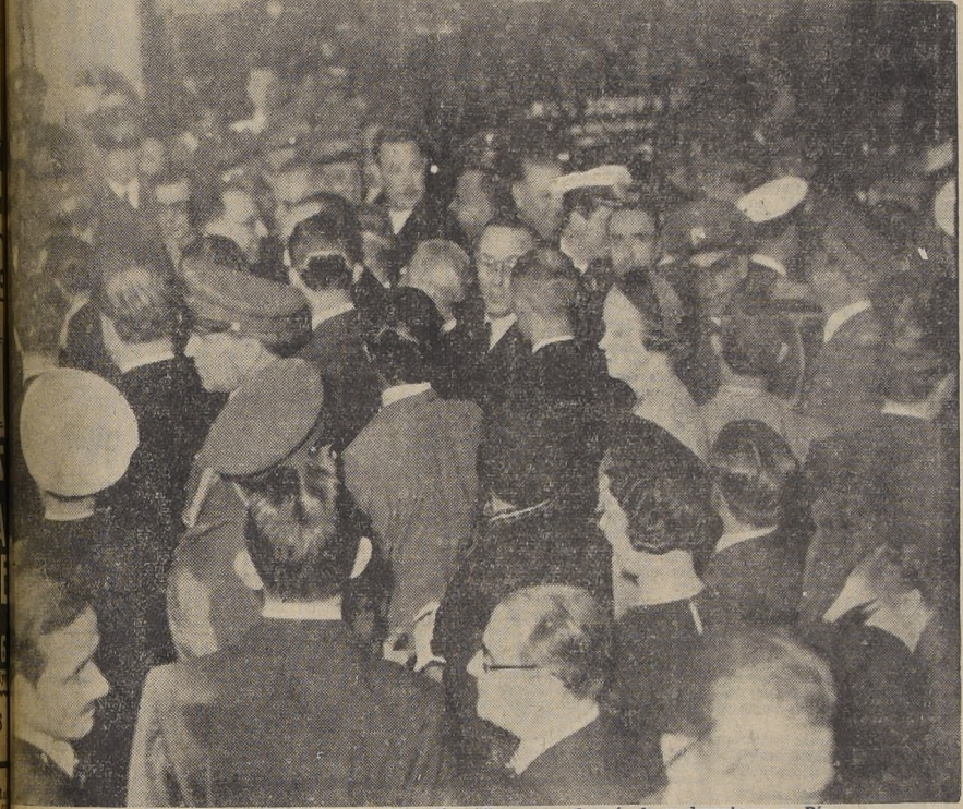
Durante el recibimiento a la delegación chilena, poco después de su desembarco en Río