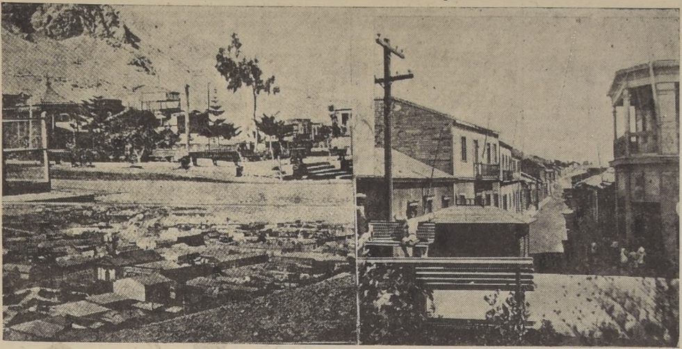
La Plaza de Armas de Chañaral, un aspecto de la parte norte de la población y la calle San Martín, donde comenzó el incendio de ayer.

Una explosión se refugió en los establecimientos públicos, en las calles y en la plaza. — Más de doscientas familias en la indigencia, a consecuencias del incendio