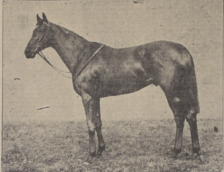
Scottish Union, que ayer en el Derby, lo mismo que en las Dos Mil Guineas, obtuvo el 2.º lugar.