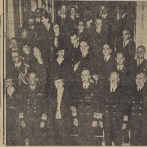
El Ministro de Marina, el almirante don Olegario Reyes del Río y otras personas en el Centro Naval

Canton tuvo hoy un día más aliviado. La mañana transcurrió sin que hubiera señales de los aparatos de bombardeo japoneses. Los cuales mataron alrededor de 2.000 personas e hirieron a unas 5.000 en cuatro días consecutivos de ataque. Un jefe de la Armada nipona desmintió que en los raids contra Canton se hubieran hecho sin "distingos". Dijo que estaban dirigidos contra objetivos absolutamente militares y centros de actividades anti-japonesas, indicando que estos últimos incluían las escuelas. Manifestó: "La política japonesa de hacer distinciones entre objetivos militares y zonas civiles no se ha modificado y ha sido estrictamente observada. Si los civiles sufren, es naturalmente lamentable. Sin embargo, debe recordarse que en agosto los jefes de la marina japonesa advirtieron a los civiles que debían permanecer alejados de las bases aéreas y establecimientos militares estratégicos de los chinos."