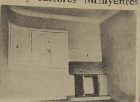
Tipo de chimenea de tendencia avanzada, adosada a esquina, con tubo de humo al exterior.

La chimenea no debe ser solamente un elemento decorativo o un accesorio de la habitación, sino un medio de calefacción, un medio de ventilación, un medio de escape de calor, un medio de escape de humo, un medio de escape de cenizas, un medio de escape de cenizas, un medio de escape de cenizas... En chimeneas pequeñas la abertura puede ser de forma cuadrada. La práctica ha demostrado que entre el área de la boca y el área del cañón de humo, debe haber una relación de 1 a 12. Es necesario insistir sobre este punto, pues se podrán descubrir en los otros dos: hogar e inclinación de las paredes, garganta y cámara de humo, por el área de la sección de concurrencia de humo es insuficiente, se deberá practicar, remanular a hacer funcionar la chimenea. Los tubos serán protegidos con un curso de ladrillo, siendo también protección útil el revestir con material refractario, piedra pómez, o cualquier materia anti-ácida que vare resultando en el muro. Posamos el segundo punto: la inclinación de los grados de los flancos de la cámara de fuego, con respecto a la pared del fondo. Es ella la que en unión con la pared posterior contribuye a la conducción del calor.