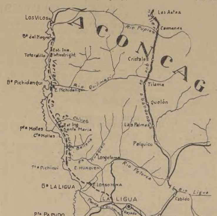
Mapa de la región y trazado de la variante Longotoma-Los Vilos