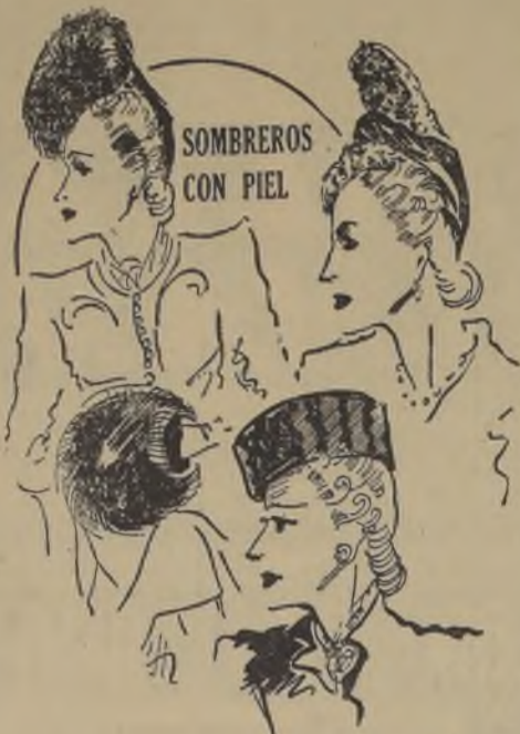
SOMBREROS CON PIEL

Piel, plumas y antilope sobre fieltro o terciopelo, dan verdadero "chic" a estas pequeñas tocas.