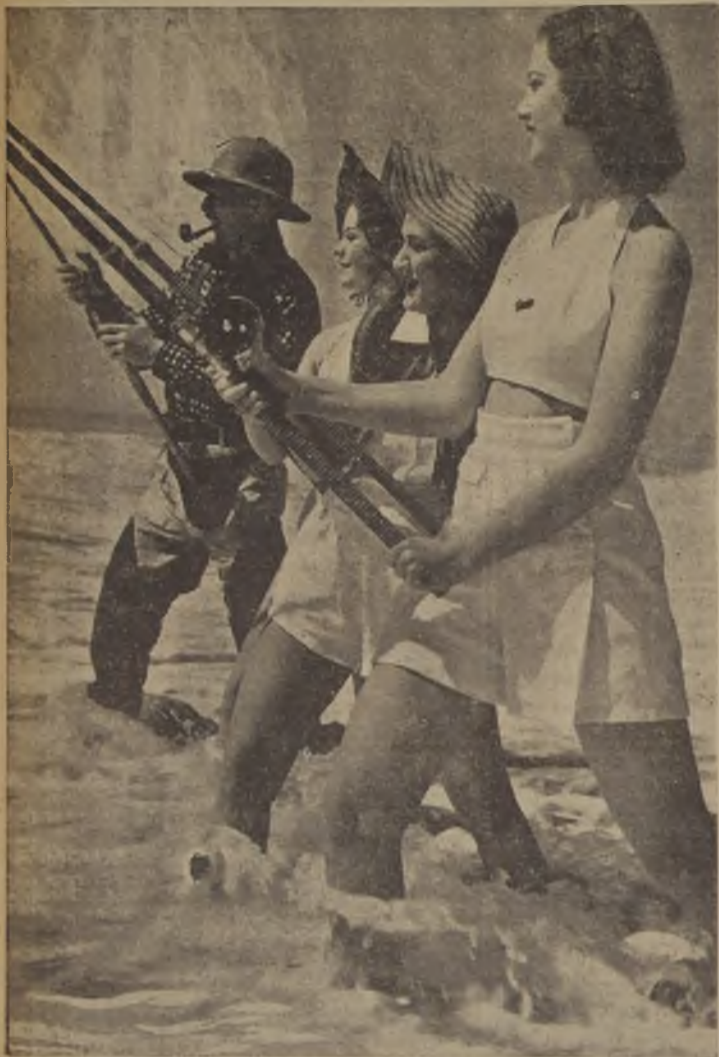
La pesca, que hasta no hace mucho era un deporte especialmente masculino, ha fructificado también ahora el campo femenino...