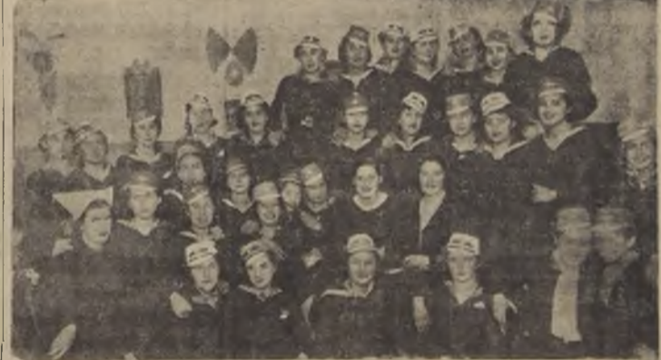
Grupo de alumnas del Instituto Comercial Femenino que celebraron con una velada y un almuerzo el aniversario de la fundación del establecimiento. A la velada concurrieron apoderadas alumnas y ex alumnas, aprovechándose, esta oportunidad para formar el "Centro de Ex Alumnas".