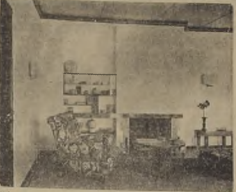
Chimenea que forma el motivo decorativo central de un living room, con tubo de humo en resalte interior.