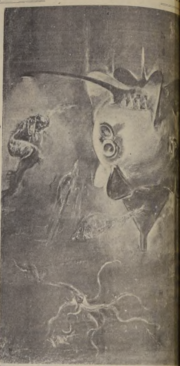
El "globo submarino" del profesor Piccard, permitirá descender por primera vez a grandes profundidades submarinas. Los animales marinos que ataquen la esfera serán alejados por medio de la electricidad