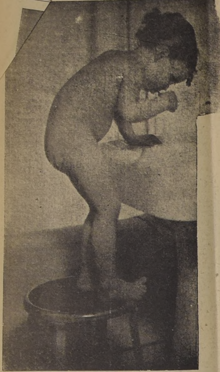
Aun cuando la fotografía no entre en el género de las bellas artes, ésta merece estar clasificada como obra de esa naturaleza.