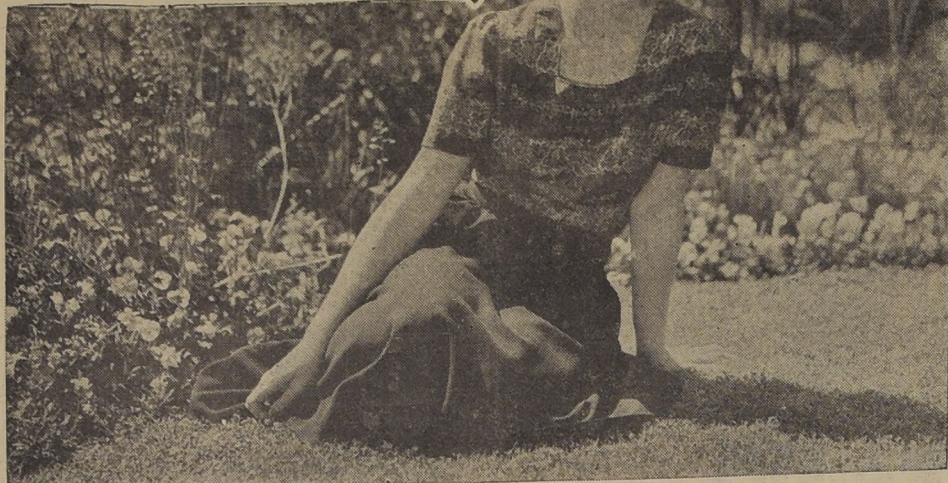
Myrna Loy, actriz de la M. G. M., más bella que nunca en su quinta de California.