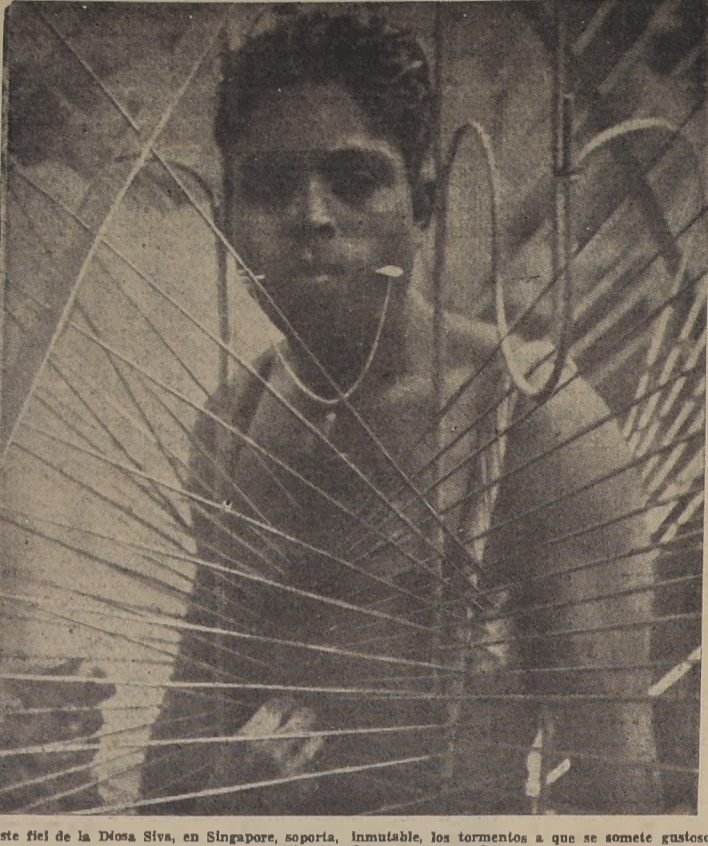
Este fiel de la Diosa Siva, en Singapore, soporta, inmutable, los tormentos a que se somete gustoso para purificación del cuerpo y del alma.