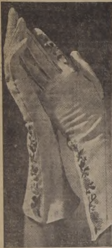
Guantes de Suecia con bordados multicolor, creación de Alexandrine.