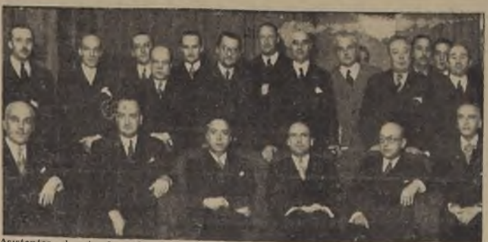
Asistentes al acto de entrega de condecoraciones en la Legación del Ecuador