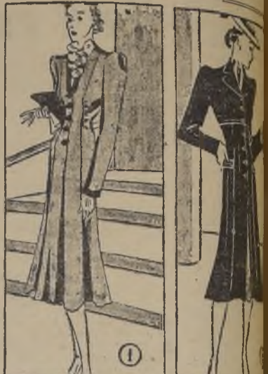
1. Tapado de lana liviana, ajustado, con faldas en forma. Puños, grandes botones y borde de la línea del cuello de terciopelo. Lleva frunces para acentuar la esbeltez de la cintura. El escote bajo permite ver los adornos en "lingerie" de la blusa en forma en la blusa.