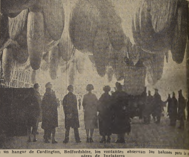
En un hangar de Cardington, Bedfordshire, los visitantes observan los balones para la fuerza aérea de Inglaterra.