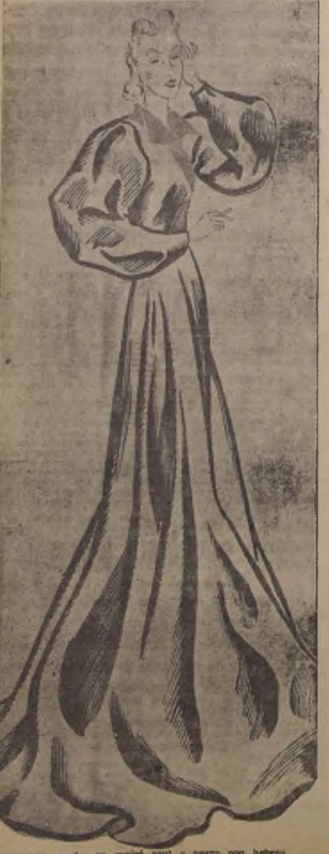
Abriego de noche en marfil azul o negro con detalles metálicos dorados, solapas y forro de satén rojo.