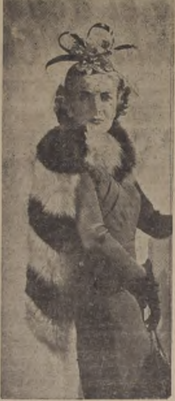
Elegante echarpe de zorros en dos tonos muy de moda en París, creación de Hélène Devigny.