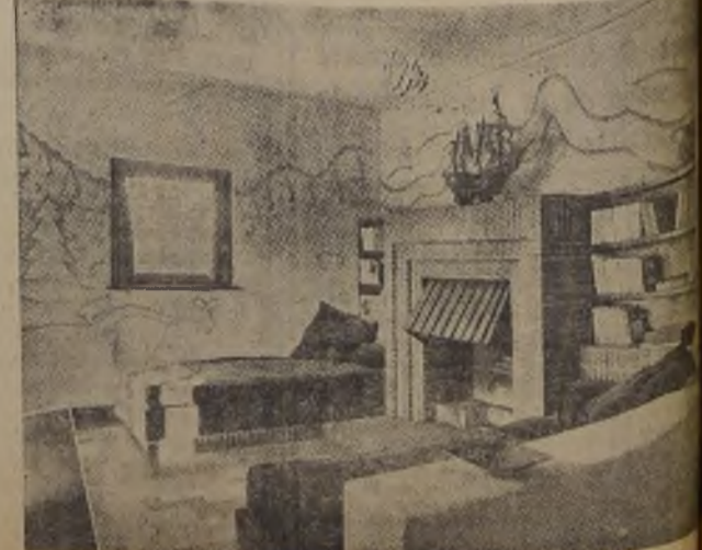
Interior moderno y confortable donde pasar las veladas de invierno.