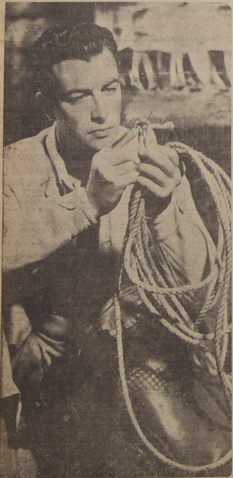
Robert Taylor, el buenmozo de la Metro Goldwyn Mayer, a quien no solamente siguen las muchachas por las calles, sino que también lo persiguen con millones de cartas de amor, que Robert Taylor hace seleccionar para leer solamente aquellas que tengan alguna originalidad.