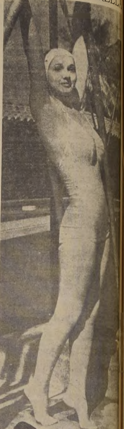
Carol Landis, que era modelo para exhibir el último grillo de la moda femenina de una casa de Nueva York, fué a Hollywood, donde siguió desempeñando su mismo papel, pero allí la conoció Frerón, y pronto será, sin duda, una nueva "estrella".