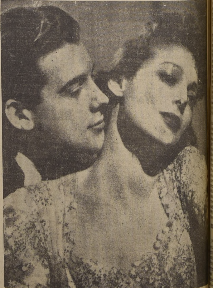
El actor inglés Richard Green, que trabaja por primera vez junto a la dulce Loneta Young, una escena romántica del melodrama de la 20th Century-Fox, titulado "Centro Hombre y Mujer", dirigido por John Ford.