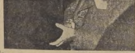
En la madrugada del miércoles, Bolivia y Paraguay firmaron en Buenos Aires una declaración que equivalía a la aceptación definitiva del tratado del Chaco...