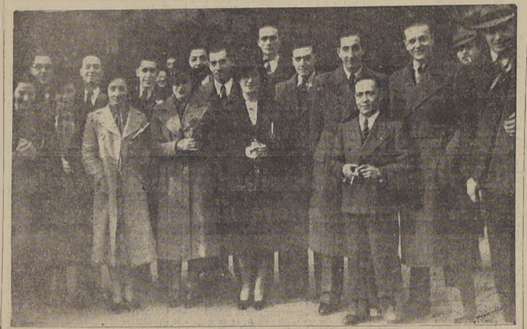
Los estudiantes de leyes, en el momento de embarcarse en viaje a Buenos Aires.

Por la combinación transandina de ayer se dirigió a Buenos Aires la delegación de estudiantes del 5.º año de la Escuela de Derecho de la Universidad de Chile, que asistirán como oyentes al Primer Congreso de Criminología que se efectuará en dicha capital.